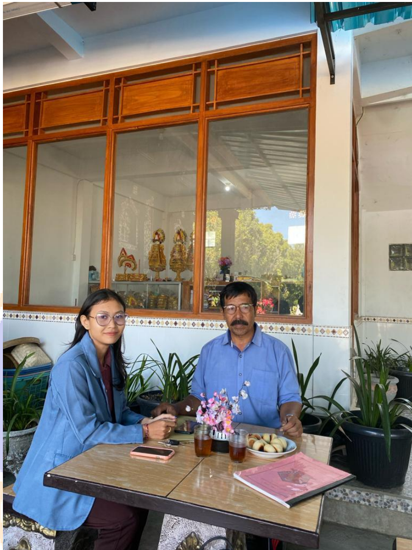
Dokumentasi Penelitian Kelian Adat Desa Adat Gesing