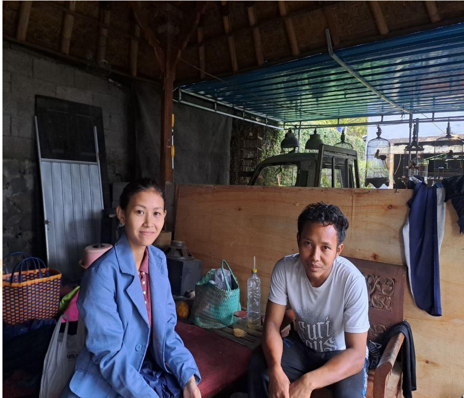
Dokumentasi Penelitian Keluarga Pengampu