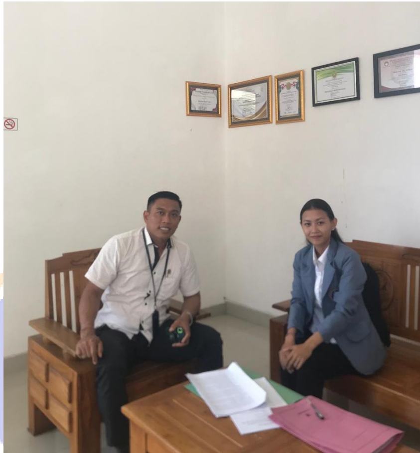
Dokumentasi Penelitian Hakim Pengadilan Negeri Singaraja