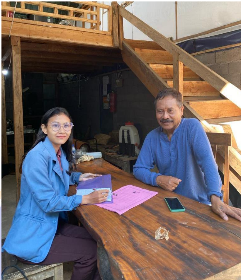
Dokumentasi Penelitian Kelian Dadia Di Desa Adat Gesing