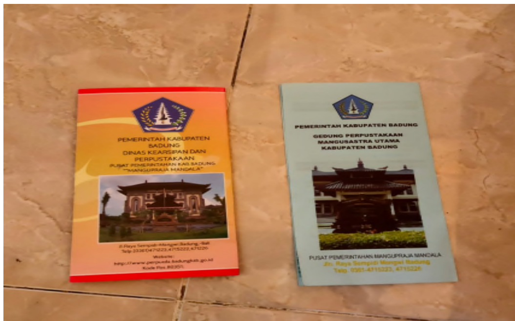
Gambar 06 : Brosur Sebagai Alat Promosi di Perpustakaan Dinas Kearsipan dan Perpustakaan Kabupaten Badung.