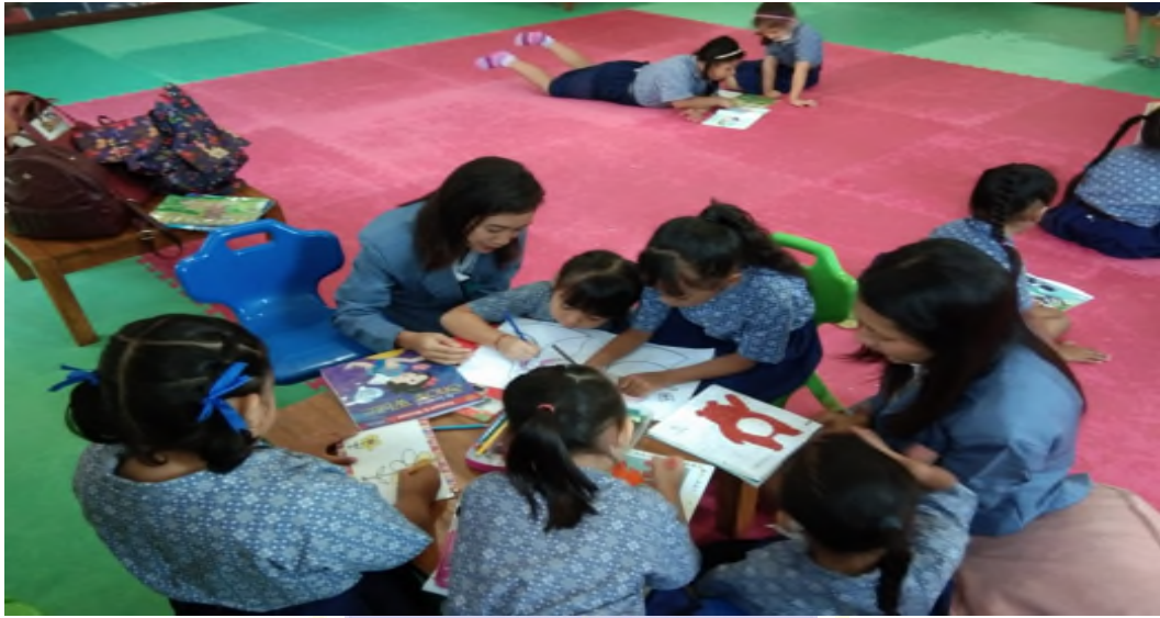
Gambar 05 : Taman Kanak-Kanak Berkunjung Ke Perpustakaan Dinas Kearsipan dan Perpustakaan Kabupaten Badung.