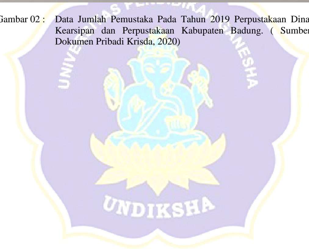
Gambar 02 : Data Jumlah Pemustaka Pada Tahun 2019 Perpustakaan Dinas Kearsipan dan Perpustakaan Kabupaten Badung. ( Sumber: Dokumen Pribadi Krisda, 2020)