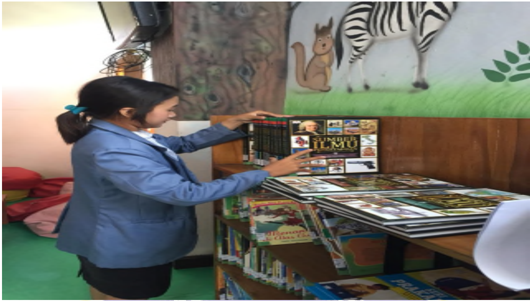
Gambar 04 : Penataan Koleksi Buku di Perpustakaan Dinas Kearsipan dan Perpustakaan Kabupaten Badung.