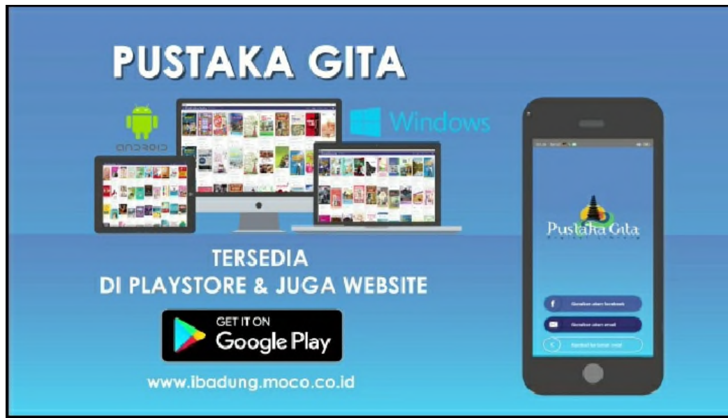
Gambar09: Iklan Pustaka Gita di Perpustakaan Dinas Kearsipan dan Perpustakaan Kabupaten Badung.