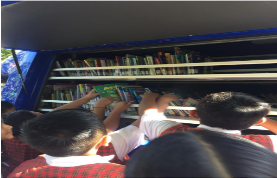
Gambar 08: Perpustakaan Keliling di Perpustakaan Dinas Kearsipan dan Perpustakaan Kabupaten Badung.