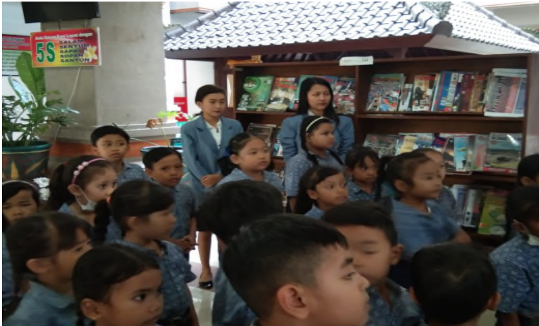
Gambar 07 : Memberikan Pengarahan Kepada Anak TK di Perpustakaan Dinas Kearsipan Kabupaten Badung.