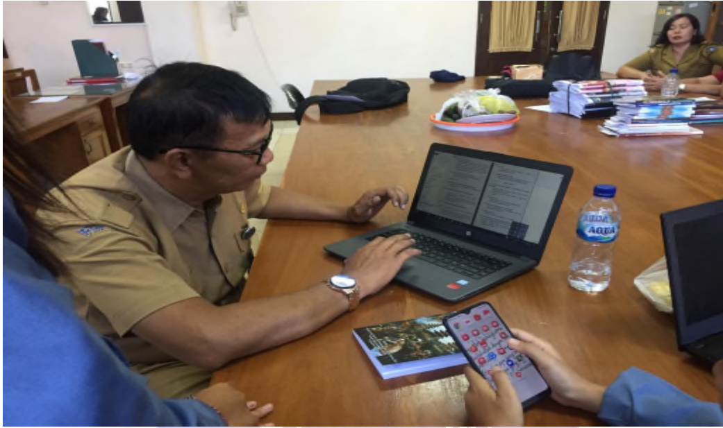
Gambar 03 : Pustakawan Menjelaskan Mengenai Sejarah Dinas Kearsipan dan Perpustakaan Kabupaten Badung.