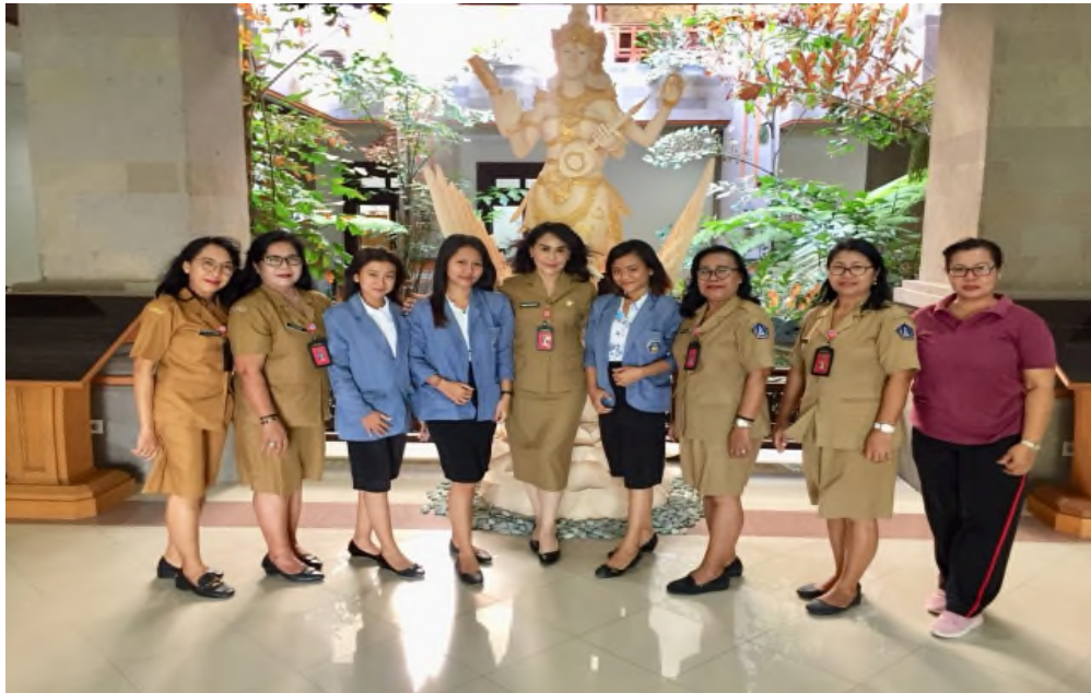
Gambar 01 : Foto Bersama Staf Dan Putakawan Perpustakaan Dinas Kearsipa Dan Perpustakaan Kabupaten Badung.