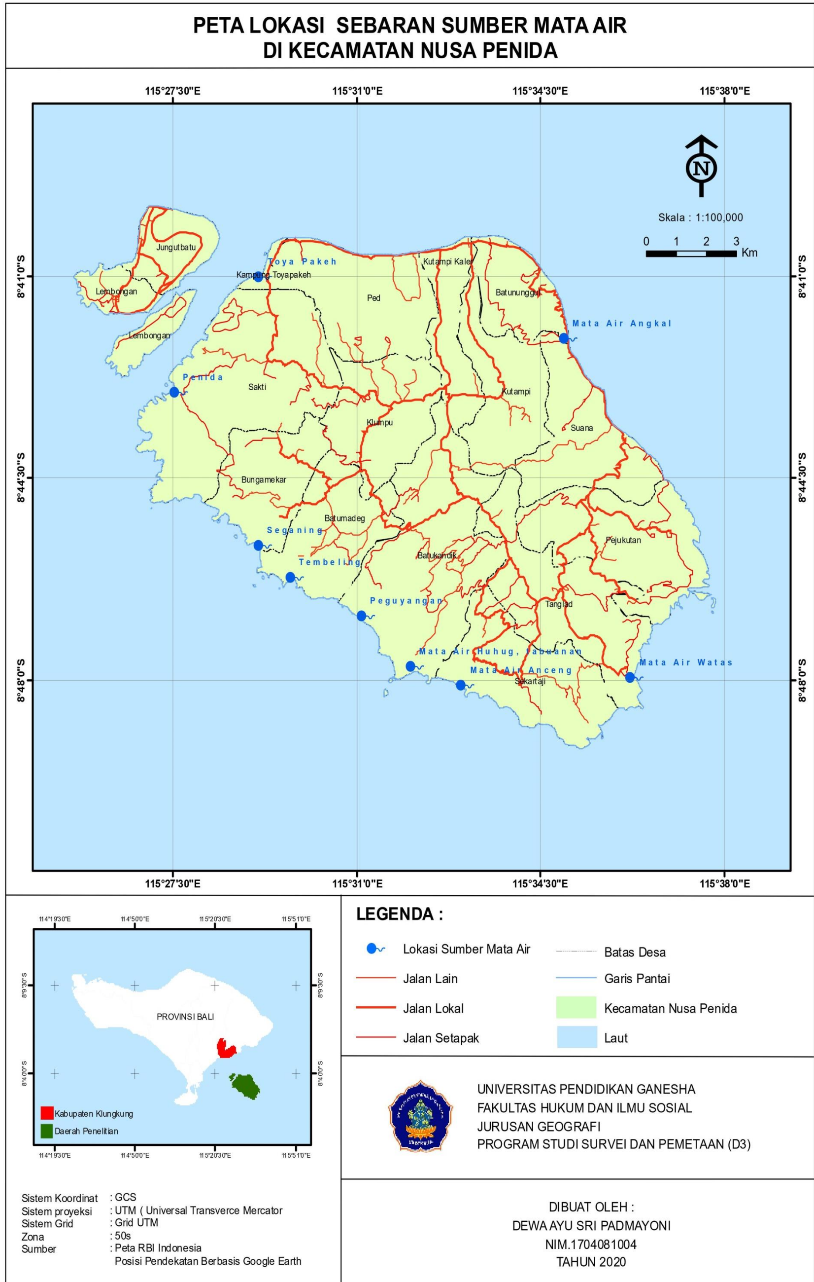
Lampiran 2. Peta Lokasi Sebaran Sumber Mata Air