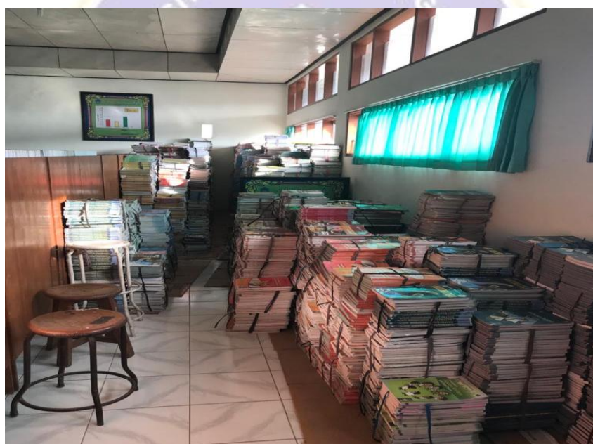
Gambar 4 Buku Yang Sudah Tertata Dengan Rapi