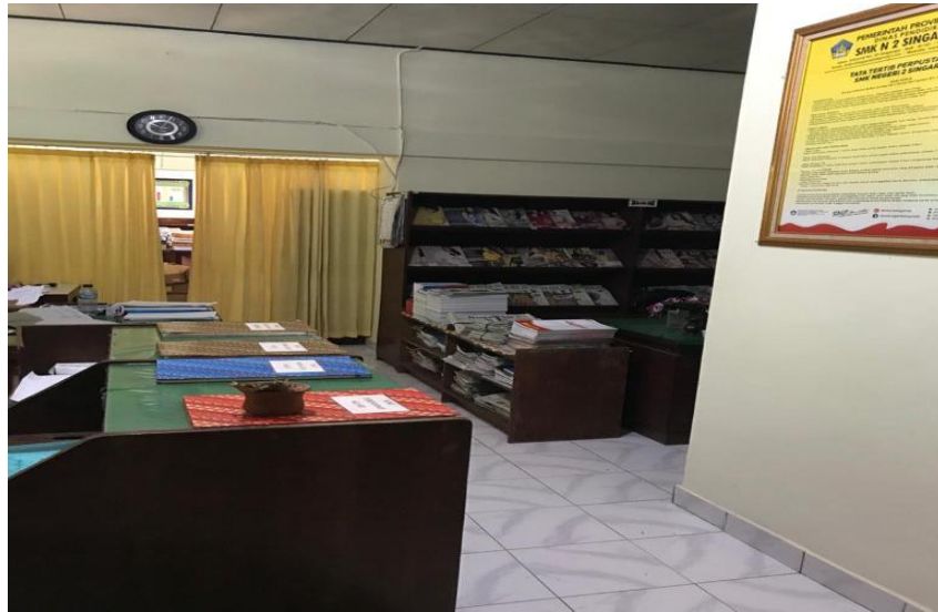
Gambar 1 Ruang Perpustakaan SMK Negeri 2 Singaraja dari depan