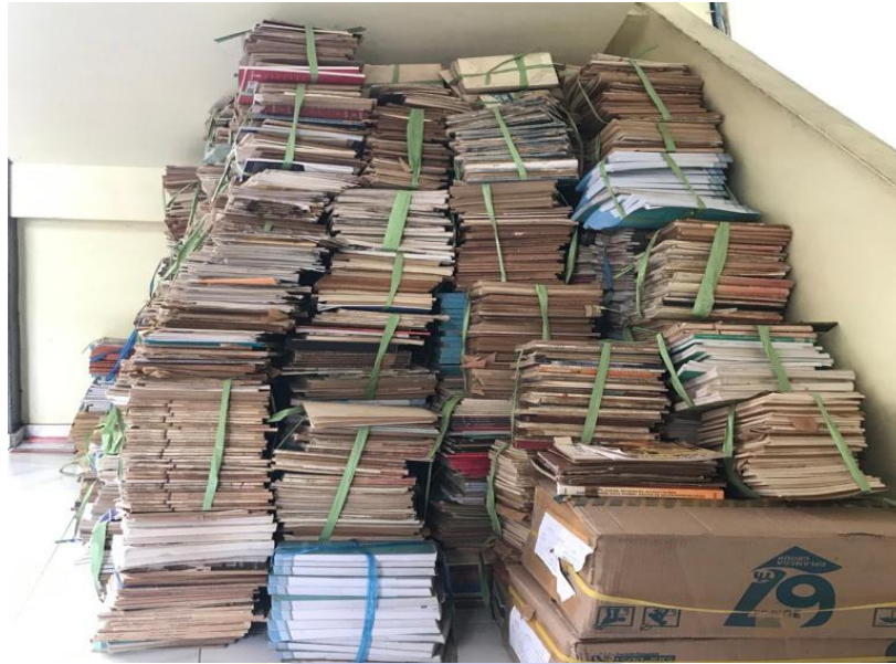
Gambar 7 Koleksi Yang Sudah Rusak Dan Tidak Layak Dipakai