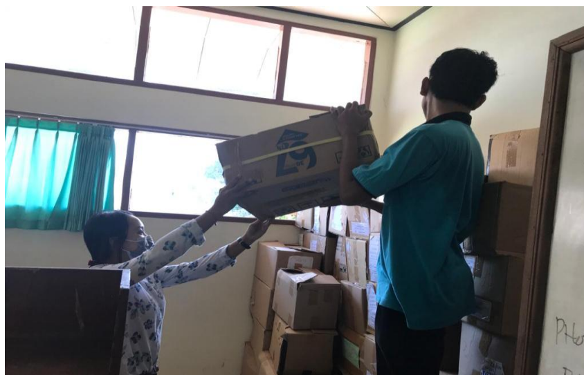
Gambar 3 Menata Ruang Perpustakaan