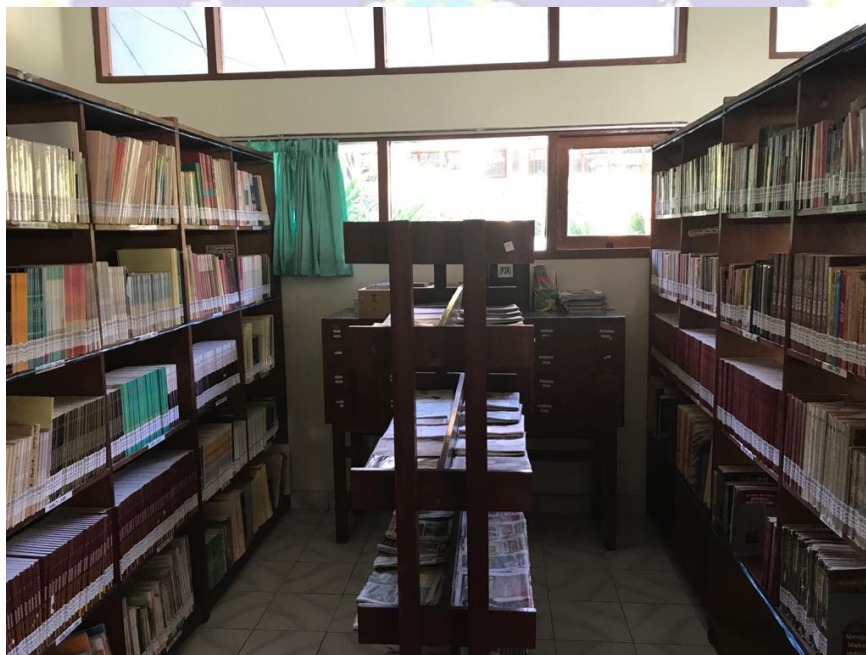
Gambar 2 Koleksi Perpustakaan SMK Negeri 2 Singaraja dari depan