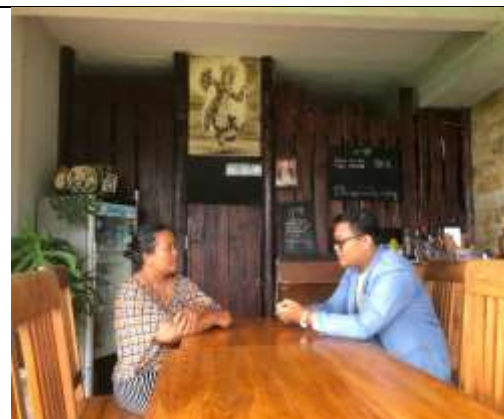
Melakukan wawancara dengan pemilik Gangga Homestay