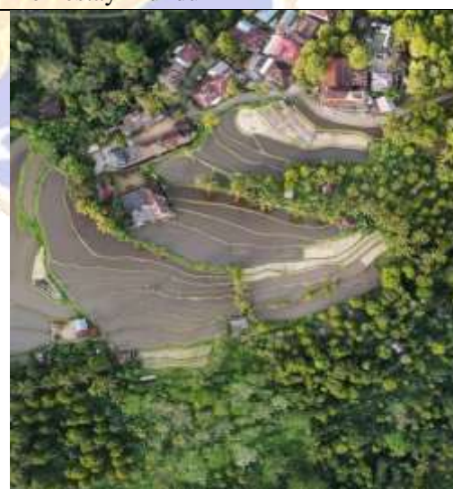
Tampak Pemandangan di sekitar Gangga Homestay Munduk