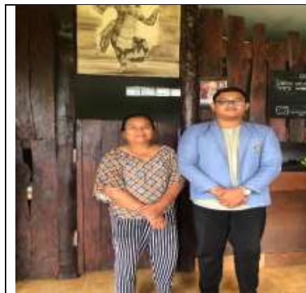
Pemilik Gangga Homestay Munduk