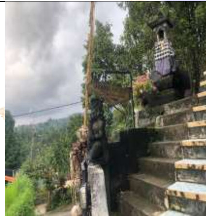
Tampak Depan Gangga Homestay Munduk