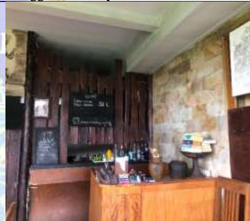
Tampak Depan Receptionis Gangga Homestay Munduk