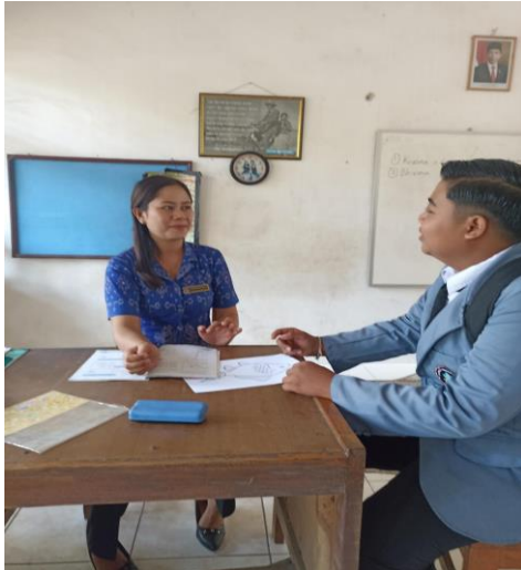
Gambar 07. Wawancara dan pemberian Kuisisioner dengan guru kelas 6.