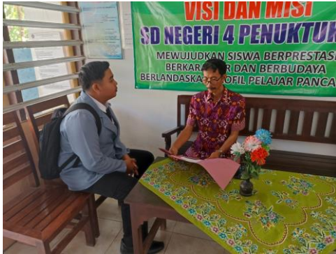
Gambar 01. Wawancara sekaligus meminta izin penelitian dengan kepala sekolah.