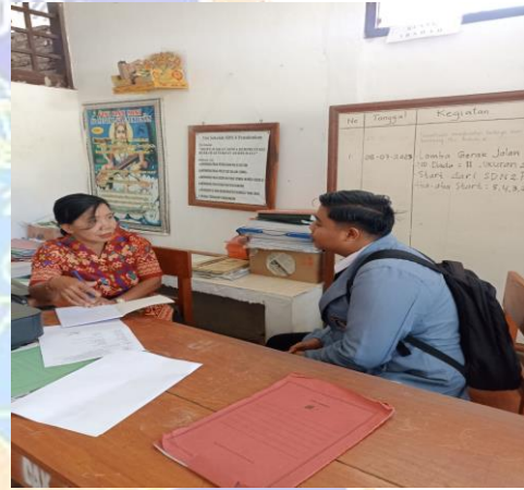
Gambar 04. Wawancara dan pemberian Kuisisioner dengan guru kelas 3.