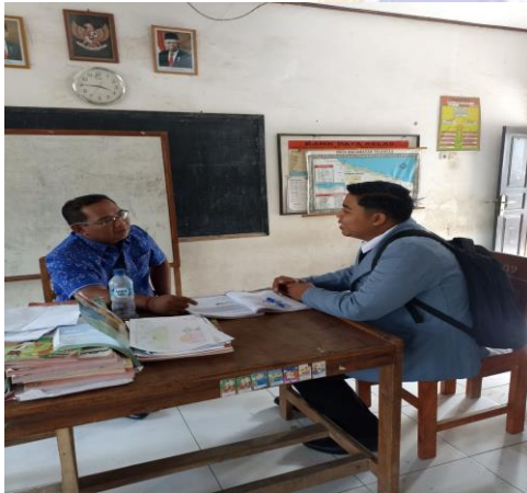
Gambar 03. Wawancara dan pemberian kuisisioner kepada guru kelas 2.