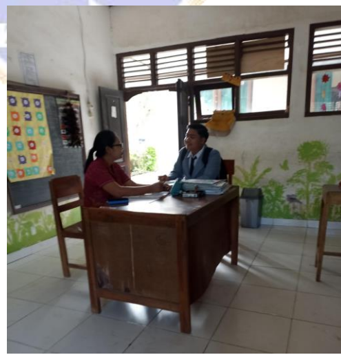
Gambar 06. Wawancara dan pemberian Kuisisioner dengan guru kelas 5.