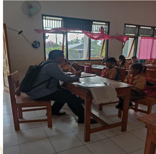
Gambar 08. Wawancara dan pemberian Kuisisioner dengan Siswa kelas 4.