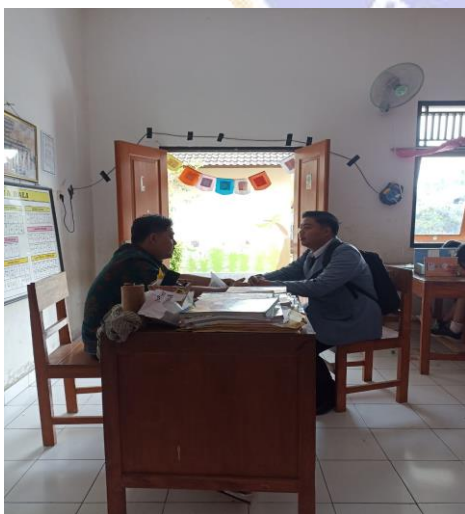
Gambar 05. Wawancara dan pemberian Kuisisioner dengan guru kelas 4.