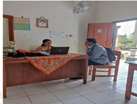
Gambar 02. Wawancara dan pemberian kuisisioner kepada guru kelas 1.