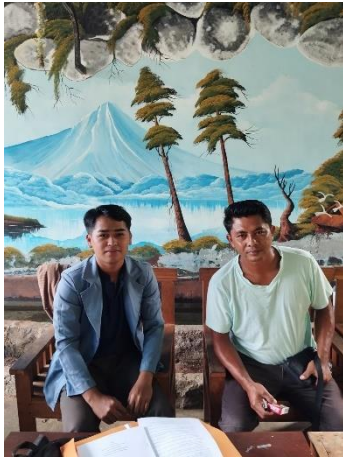
Gambar. Wawancara dengan Penasehat BUMDes