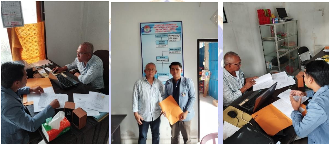
Gambar. Wawancara dengan Dirktur BUMDes