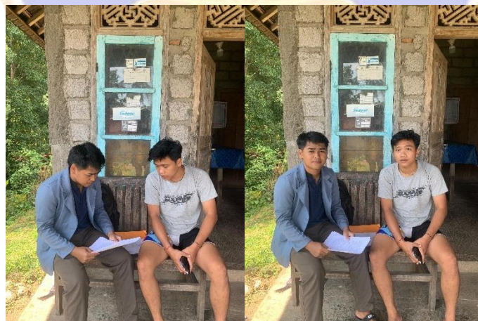
Gambar wawancara dengan Karyawan BUMDes