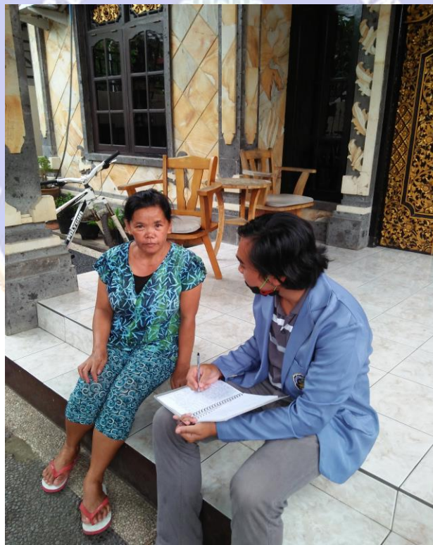
Wawancara penulis dengan konsumen makanan industri rumah tangga