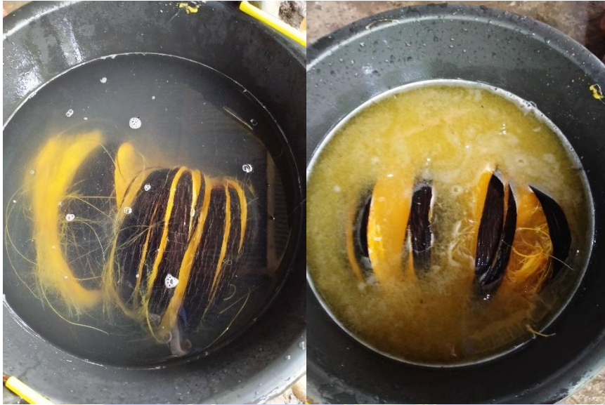
Gambar 1. Perendaman buah lontar hari pertama dan dua minggu