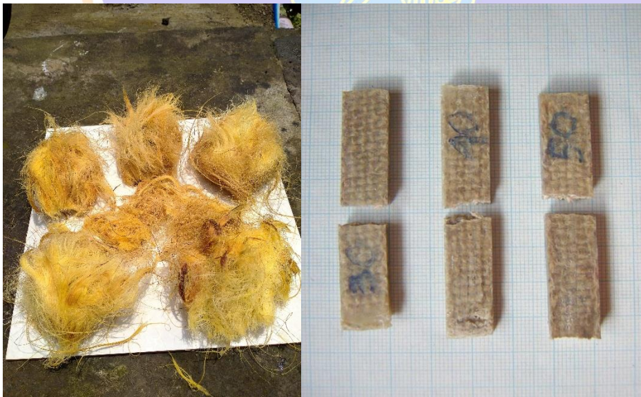
Gambar 2. Proses pengeringan serat dan bentuk patahan