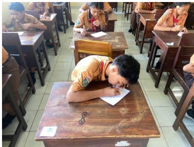
Picture 2. Activity of class 8A students learning to speak English