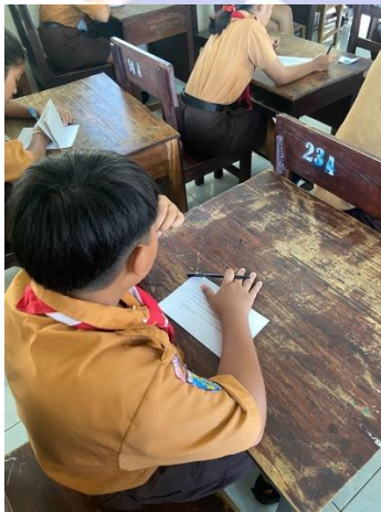
Picture 5. Students listening to the researcher talking