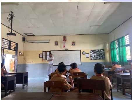
Picture 9. English teacher teaching