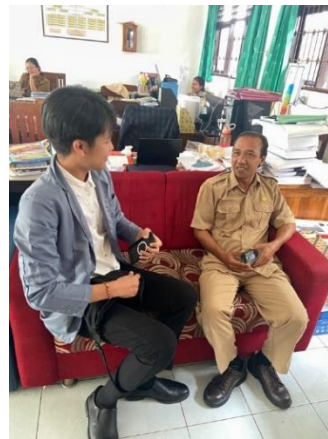
Picture 7. Interview with English teacher