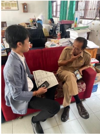
Picture 6. Interview with English teacher