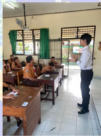
Picture 4. The researcher is talking