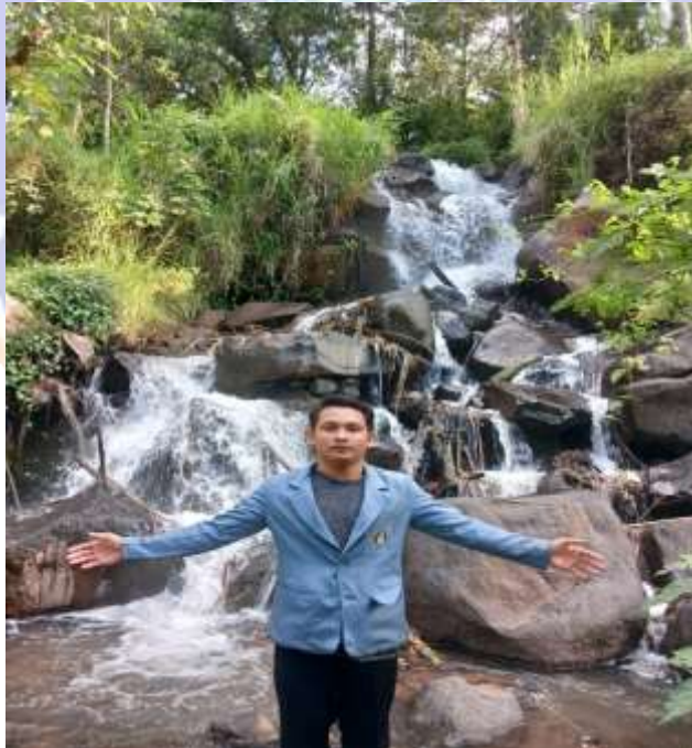
Lampiran 2 Pemandian Alam Desa Bebetin