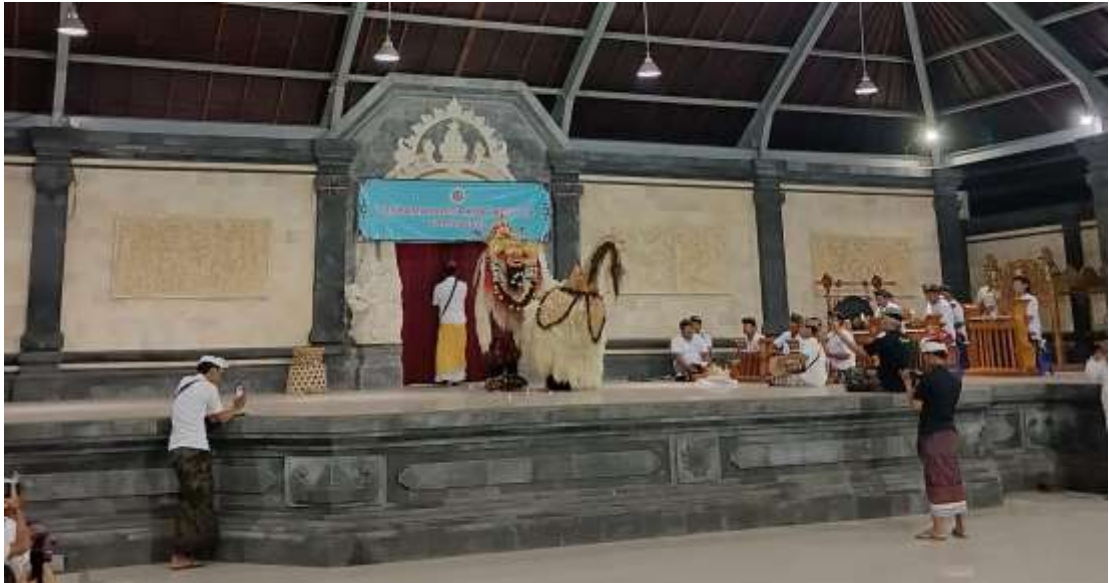
Lampiran 3 Pertunjukan Barong Desa Bebetin