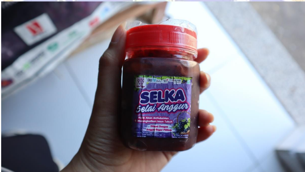
Foto Produk Selai Ketika Berkunjung ke Perusahaan