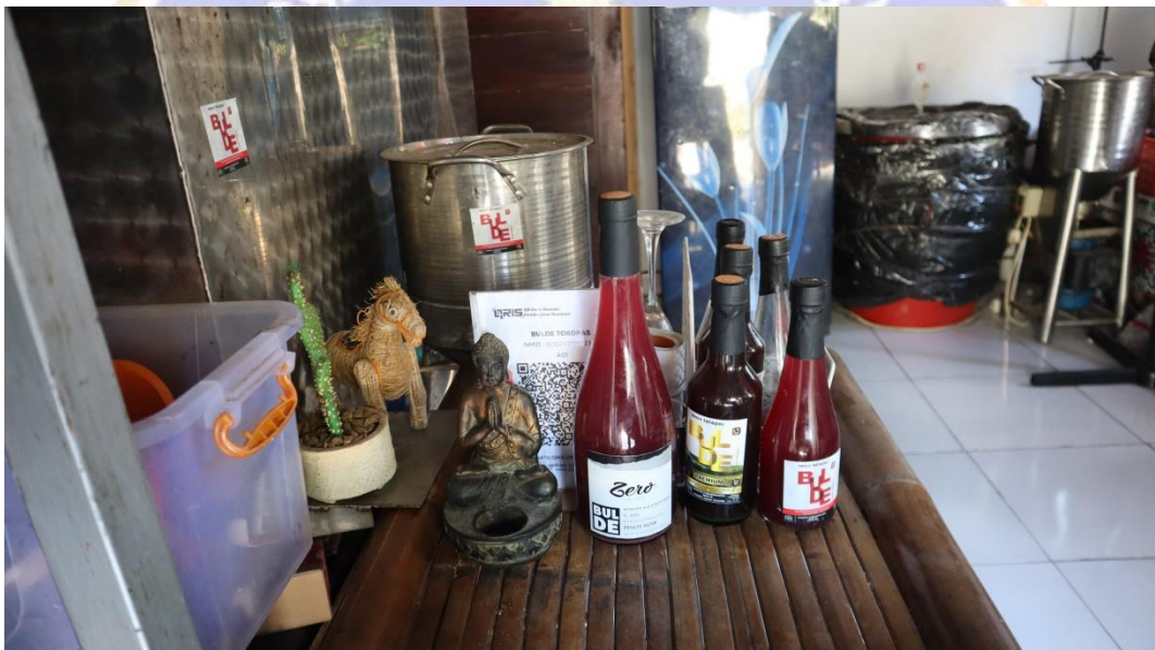
Foto Produk Lainnya Yang Ditawarkan Owner