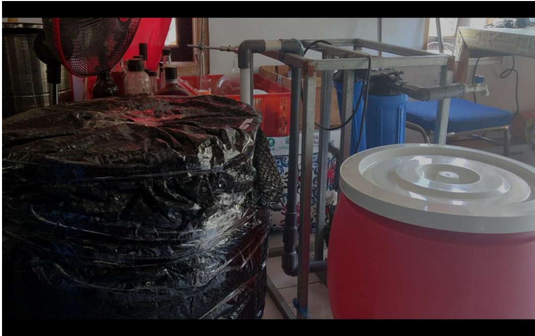
Foto Fermentasi Olahan yang Ada di Perusahaan