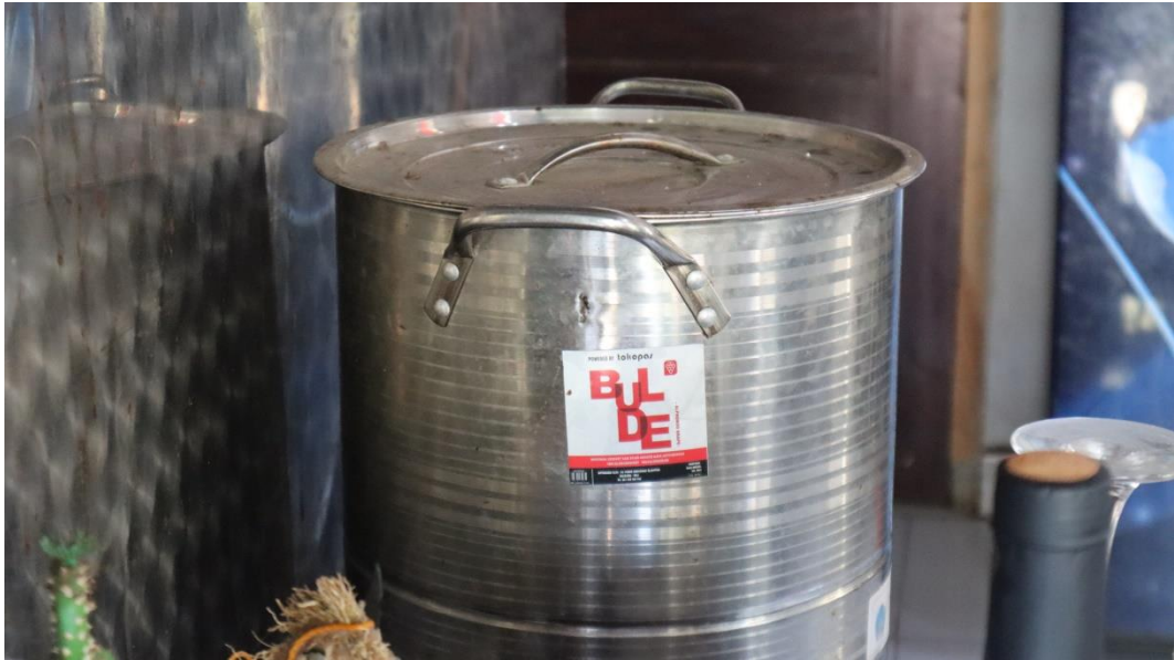
Foto Bahan Olahan yang Ada di Perusahaan