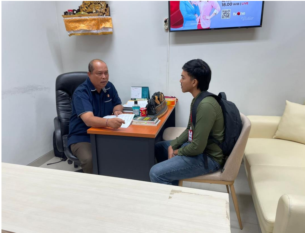
Gambar 01 Foto Bersama Plt. Kasubag Bin Ops Ditreskrimsus Polda Bali