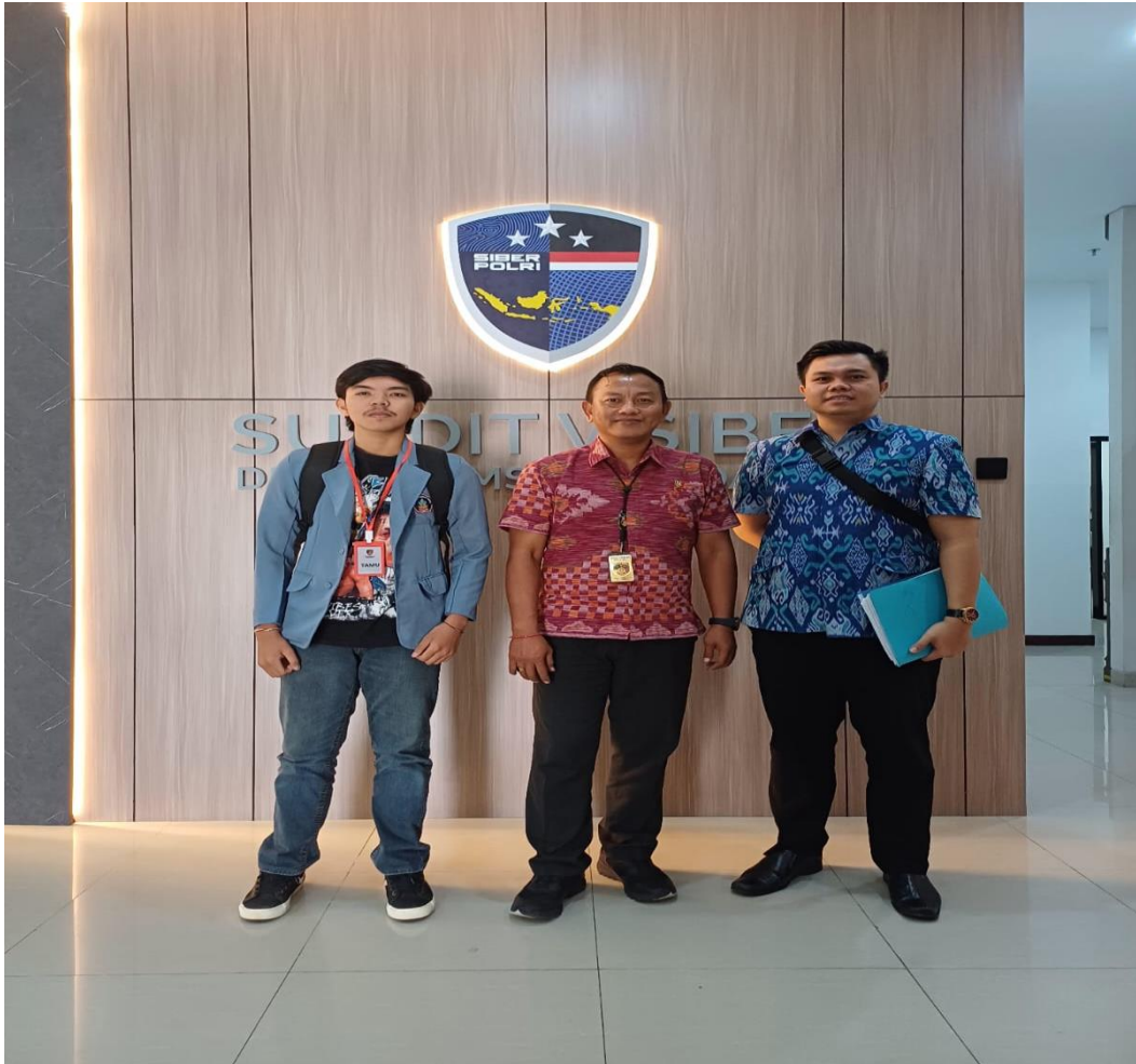
Gambar 03 Foto Bersama Kanit 1 dan Anggota Subdit V Siber Ditreskrimsus Polda Bali