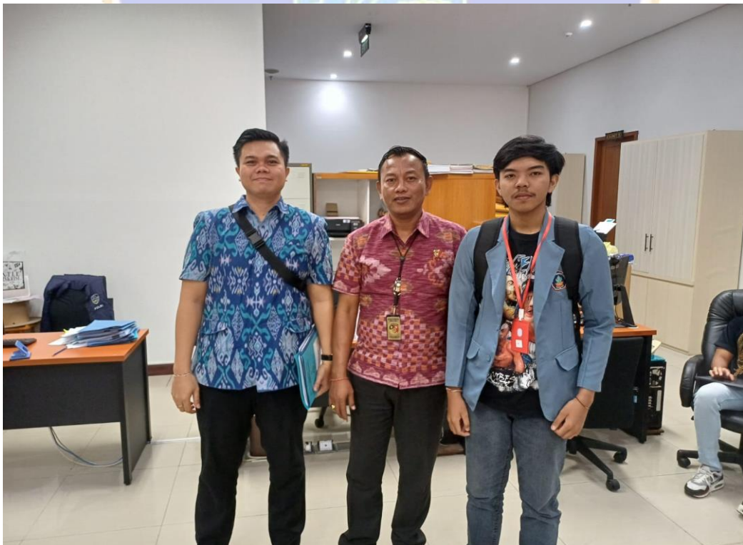
Gambar 02 Foto Bersama Kanit 1 dan Anggota Subdit V Siber