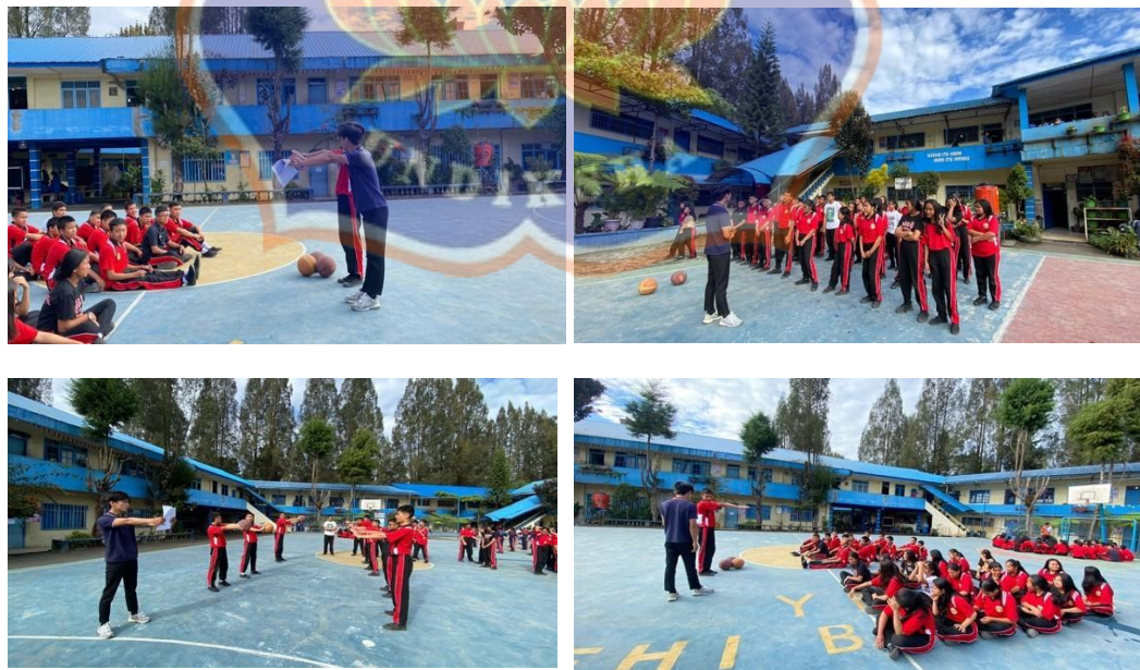
Model Pembejaran Kooperatif Tipe NHT