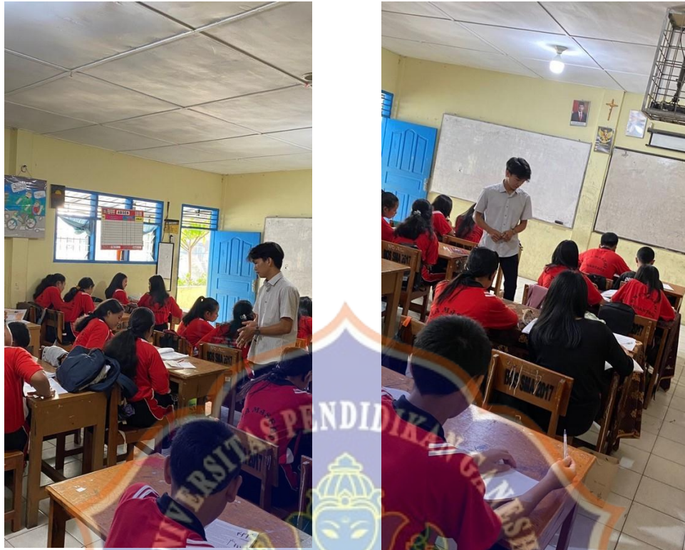
Model Pembejaran Langsung