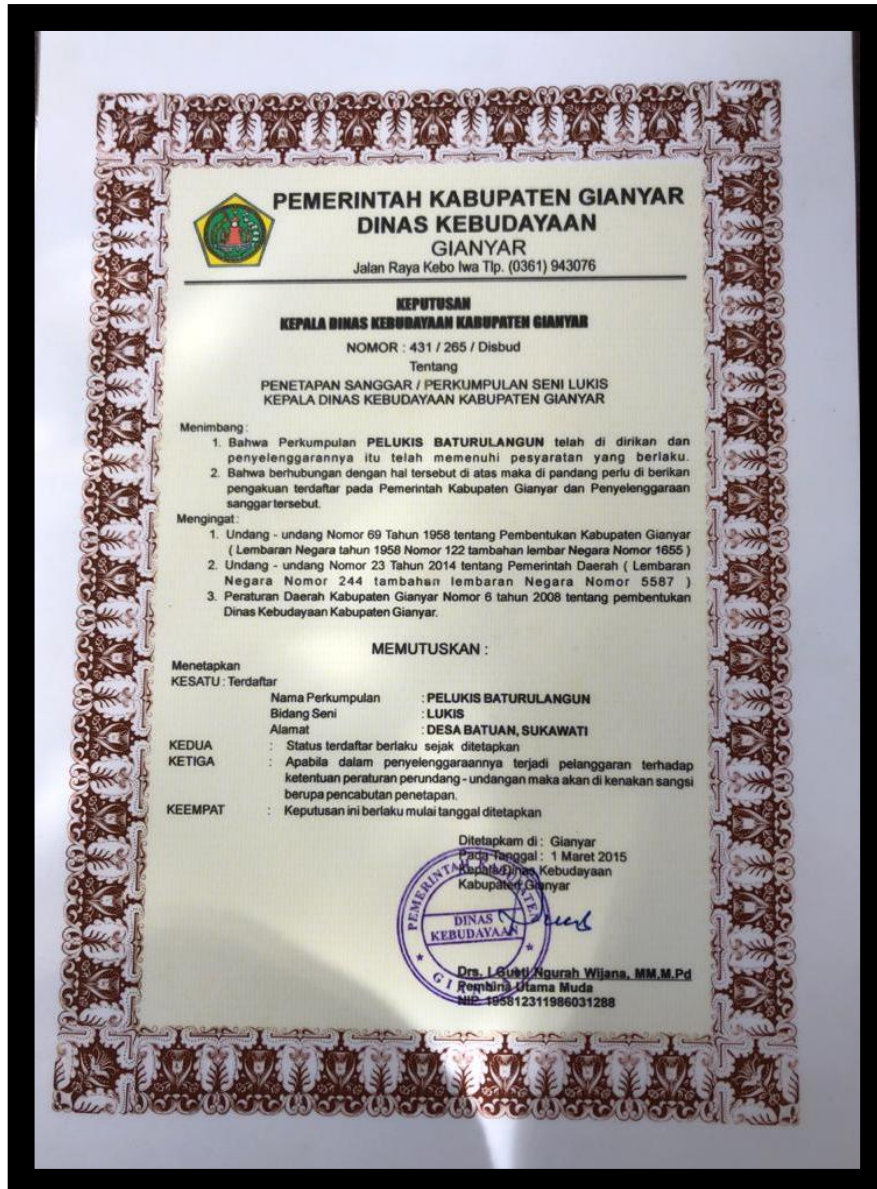
Foto Sertifikat Pengesehan Komunitas Baturulangun