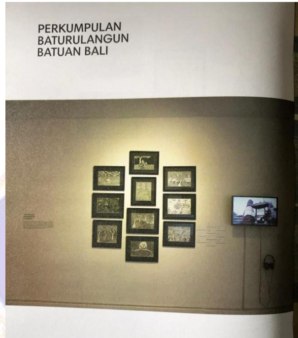
Foto Katalog Pameran Karya Peserta Didik Alih Keterampilan Di Galeri Nasional