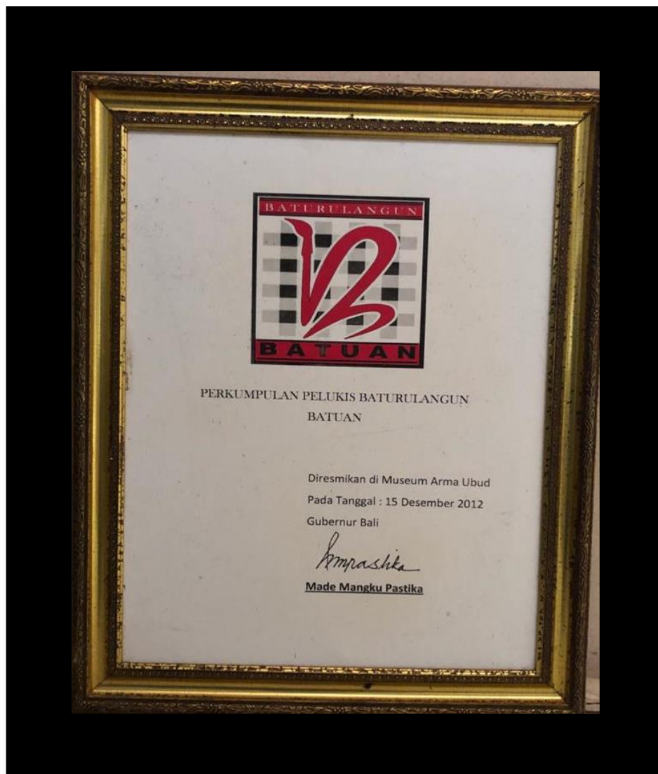
Foto Peresmian Komunitas Baturulangun Batuan