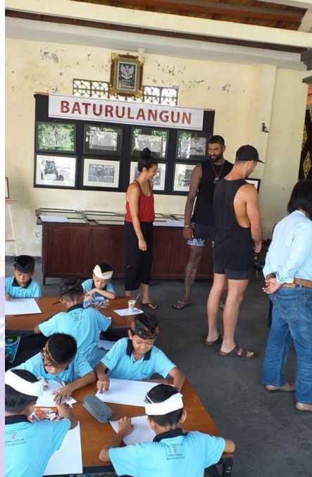
Foto Tempat Penelitian Dan Kegiatan