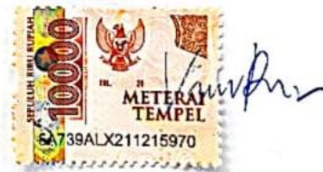
Vickha Putri Suprpto