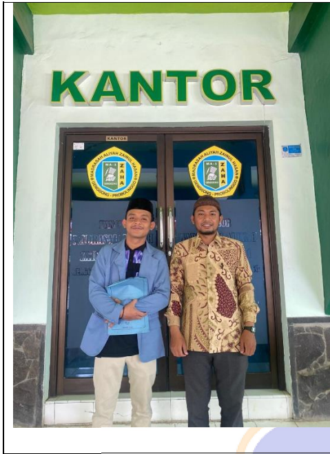
Gambar 4. Bersama Guru Sejarah MA Zainul Hasan