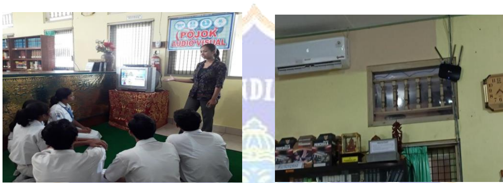
Pojok Audio Visual