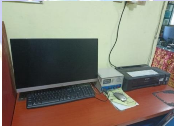
Layanan Fotokopi dan Print