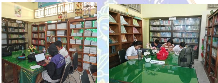
Layanan Membaca di Tempat