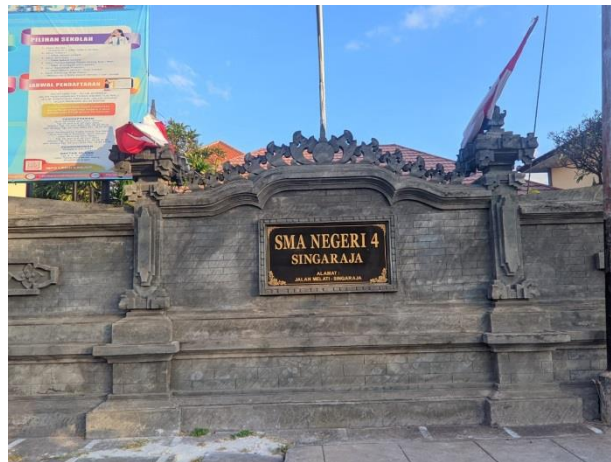
Tampak depan SMA Negeri 4 Singaraja