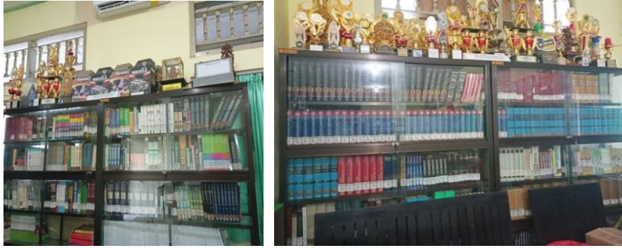
Koleksi Referensi