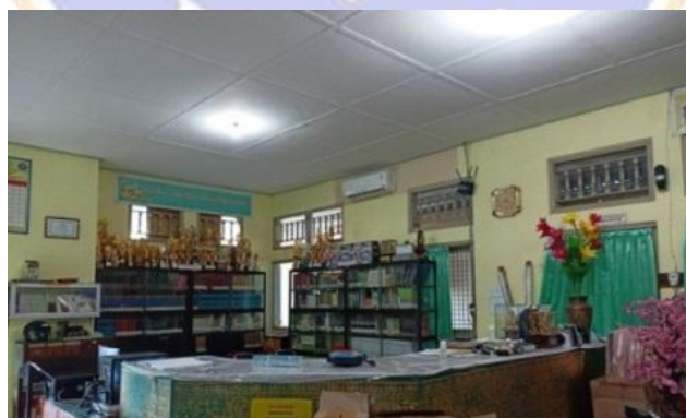
Meja Sirkulasi