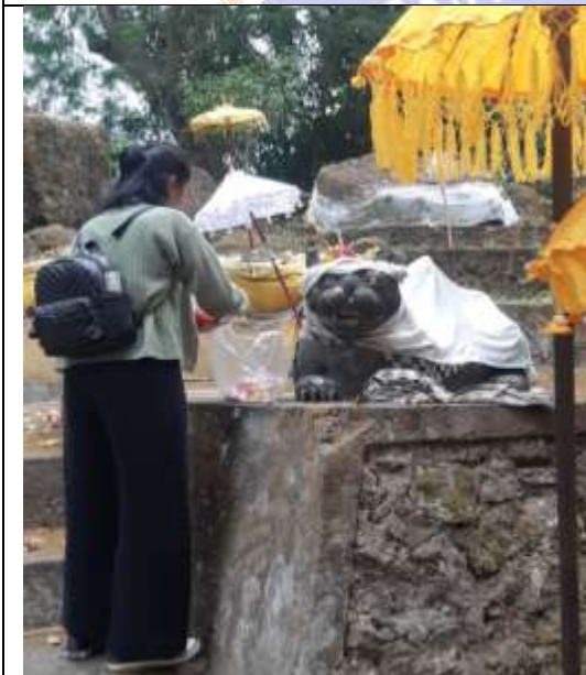
Gambar 02. Proses Observasi ke Peninggalan Megalitik di Desa Mayong