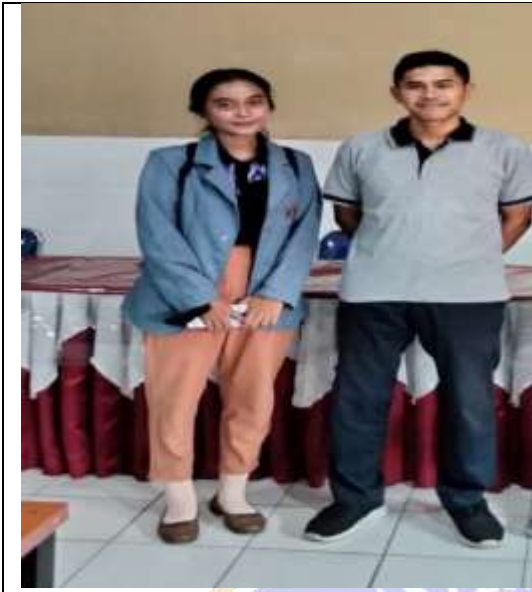
Gambar 01. Foto bersama Guru Sejarah SMAN 1 Busungbiu