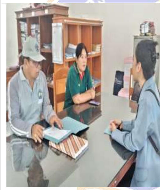
Gambar 04. Proses wawancara dengan Kepala Adat Desa Mayong bersama dengan staff desa