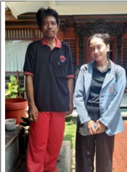
Gambar 03. Foto bersama salah satu pengelola Museum Buleleng