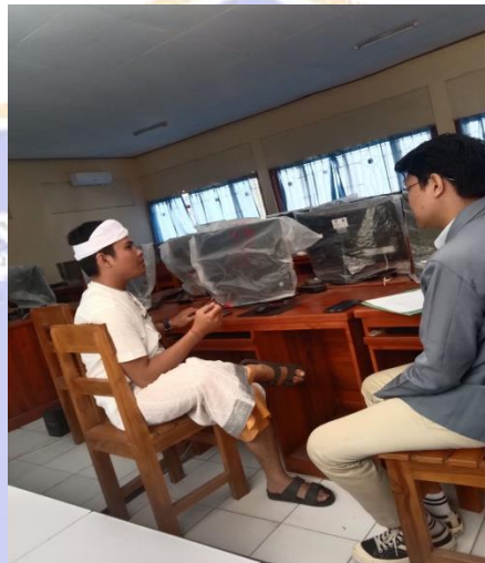
Gambar 5. Wawancara dengan Guru Mata Pelajaran IPA SMP Negeri 7 Singaraja