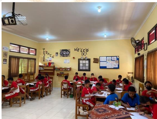
Gambar 3. Penyebaran angket di SMP Negeri 8 Singaraja