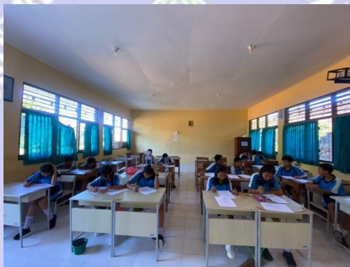
Gambar 2. Penyebaran angket di SMP Negeri 7 Singaraja