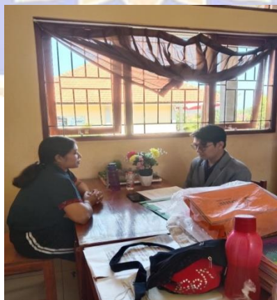
Gambar 6. Wawancara dengan Guru Mata Pelajaran IPA SMP Negeri 8 Singaraja