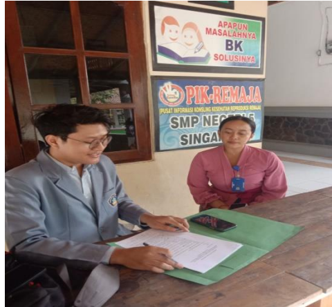
Gambar 4. Wawancara dengan Guru Mata Pelajaran IPA SMP Negeri 5 Singaraja