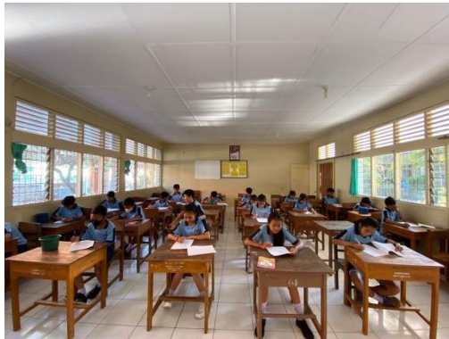
Gambar 1. Penyebaran angket di SMP Negeri 5 Singaraja