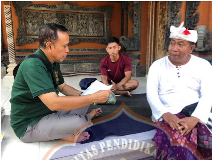
Appendix 8. Pictures of interview in Guliang Village