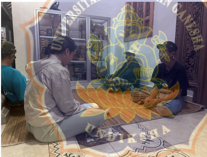
Appendix 7. Pictures of interview in Kawan Village