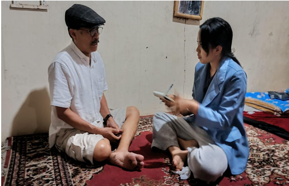
Lampiran 3.8 Wawancara Bersama Pengawas LPD