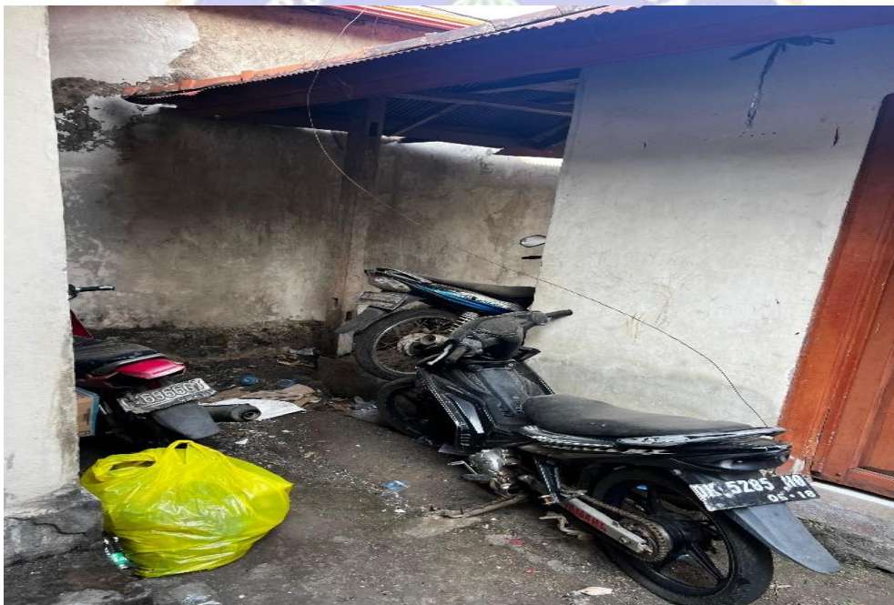
Lampiran 3.9 Jaminan Yang Sudah Disita