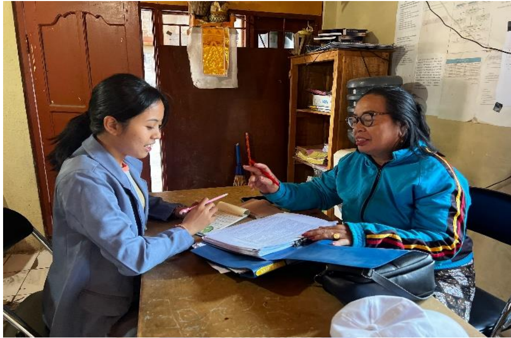
Lampiran 3.6 Wawancara Bersama Kabag Tabungan LPD