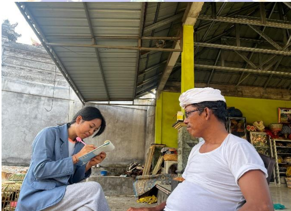
Lampiran 3.7 Wawancara Bersama Prajuru Desa Adat Munti Gunung