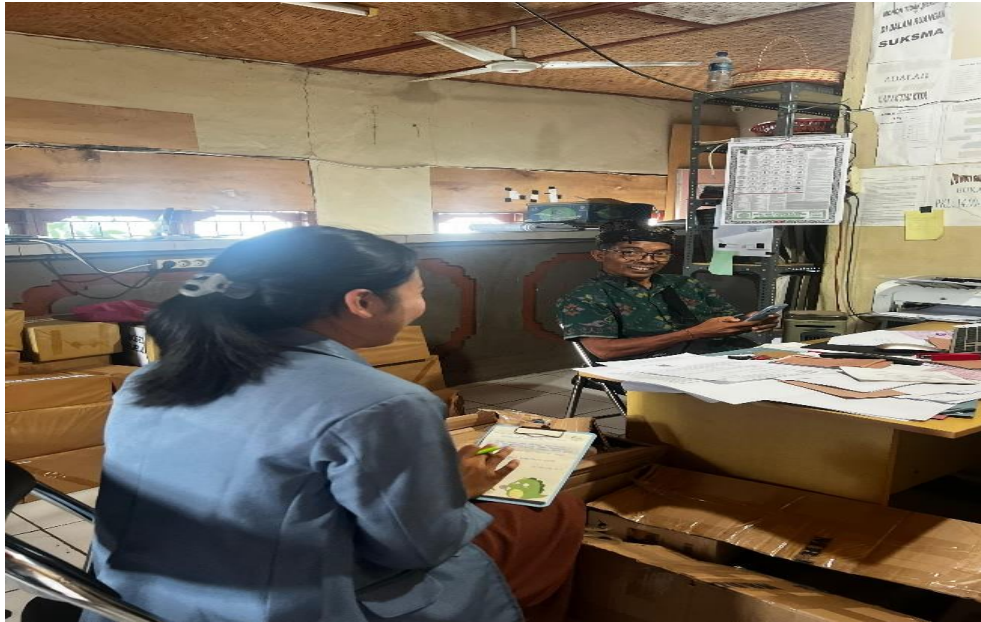
Lampiran 3.4 Wawancara Bersama Sekretaris LPD