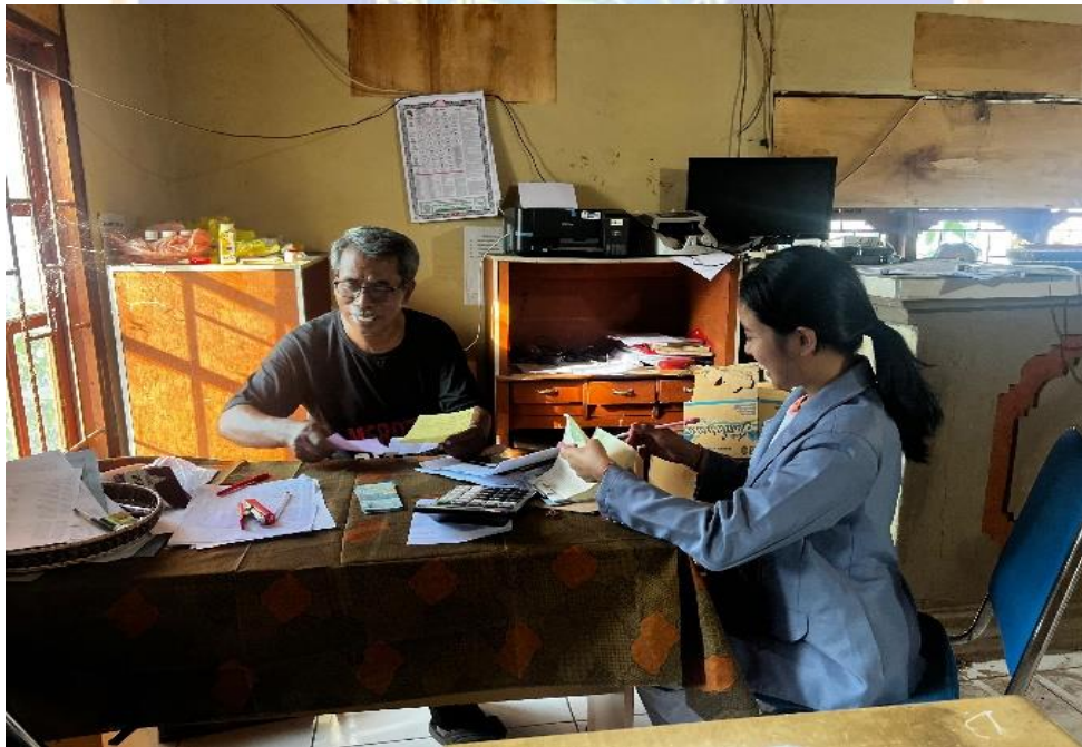
Lampiran 3.5 Wawancara Bersama Kepala LPD