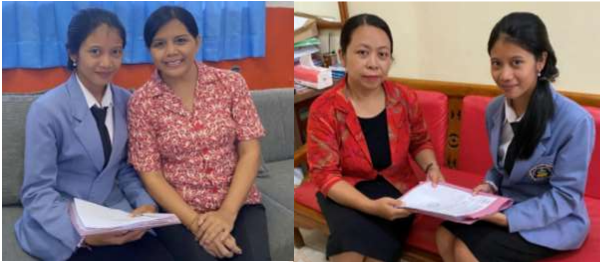
Penyebaran Kuesioner Ke Sekolah-Sekolah