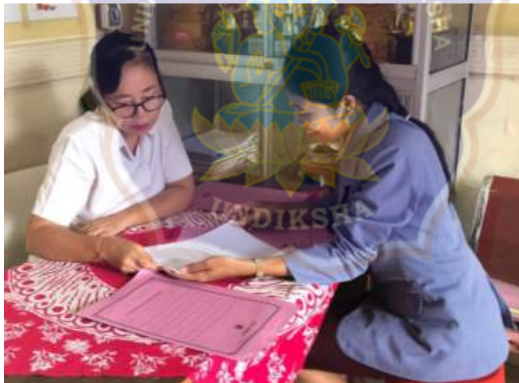
Pemberian Kuesioner serta memberikan penjelasan singkat kepada Guru