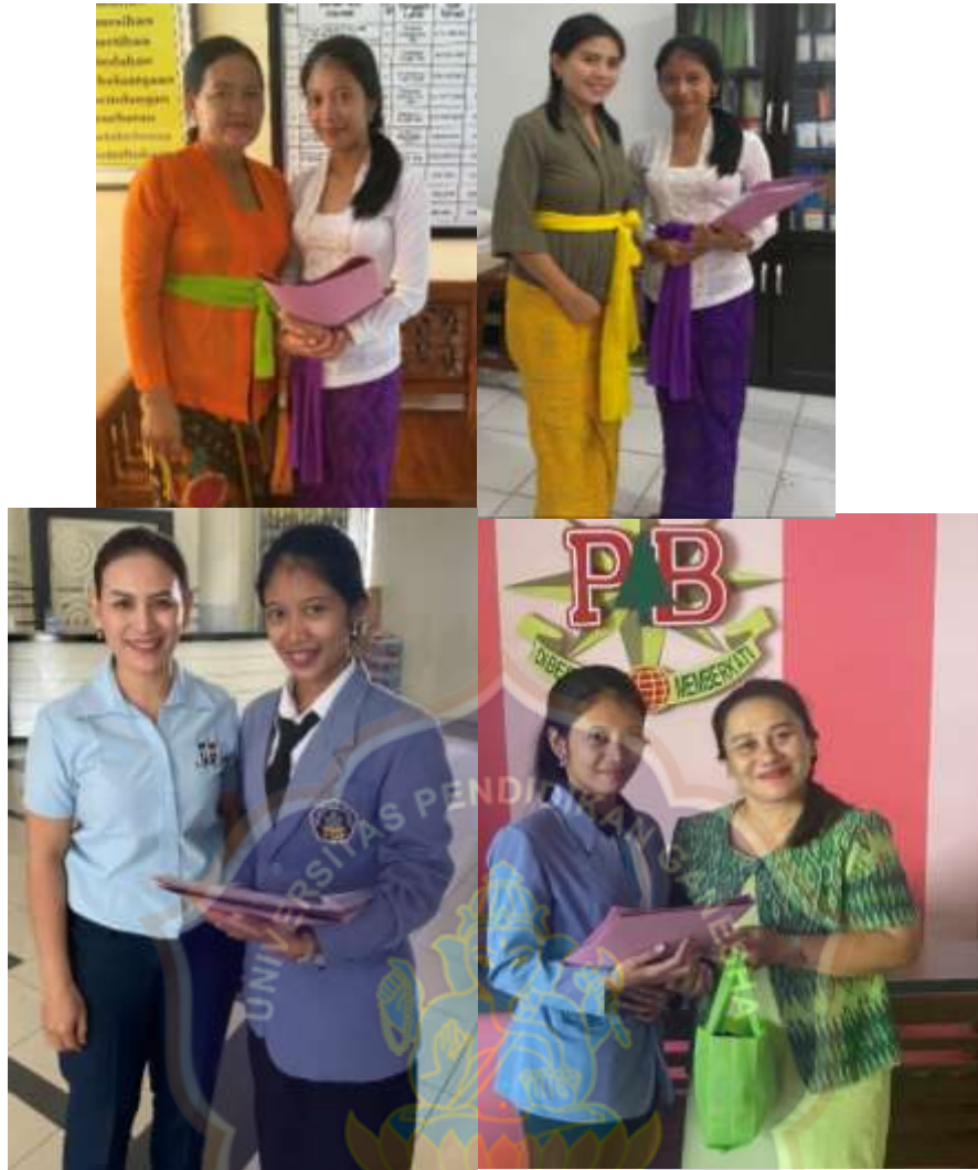
Berfoto dengan Kepala Sekolah Setelah Melakukan Penelitian