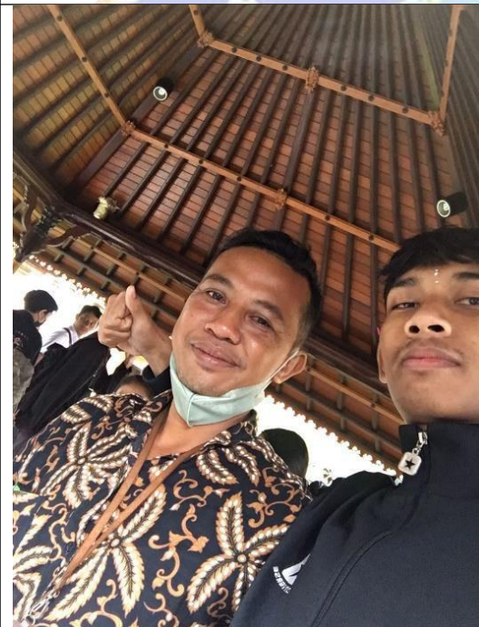
Gambar 02. Dokumentasi saat pengambilan data wawancara dengan pegawai Balai Pelestarian Kebudayaan XV sekaligus masyarakat adat Tegallingah