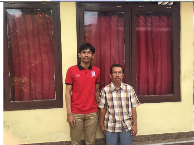
Gambar 05. Dokumentasi pada saat pengambilan data wawancara dengan guru Mata Pelajaran Sejarah di SMA Negeri 1 Gianyar.