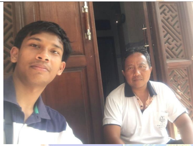
Gambar 04. Dokumentasi pada saat pengambilan data wawancara dengan Kelian Dinas Banjar Tegallingah, Desa Bedulu, Kecamatan Blahbatuh, Kabupaten Gianyar.