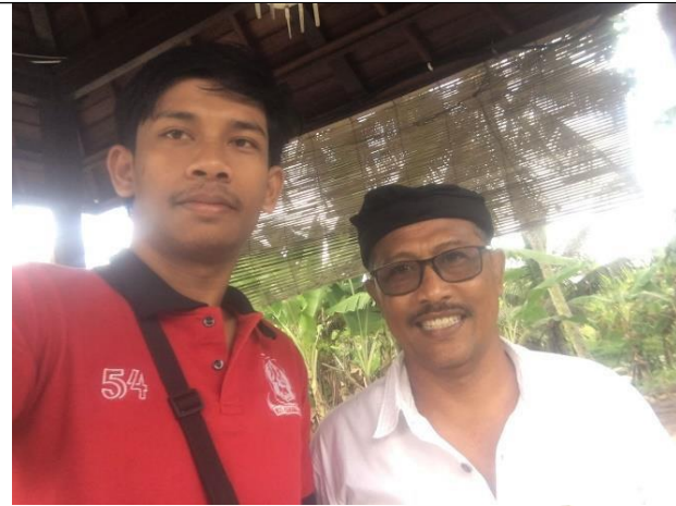
Gambar 03. Dokumentasi pada saat pengambilan data wawancara dengan staff Candi Tebing Tegallingah sekaligus pegawai Dinas Pariwisata Kabupaten Gianyar