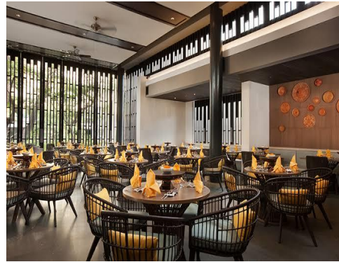
( Seats di dalam restoran Kunyit)