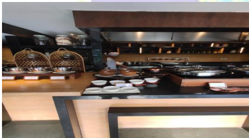
( Show Kitchen untuk Breakfast )