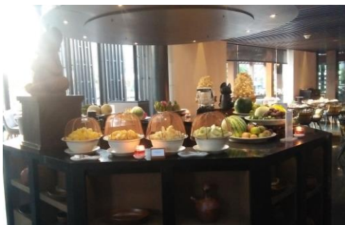
( Fruits station pada breakfast)