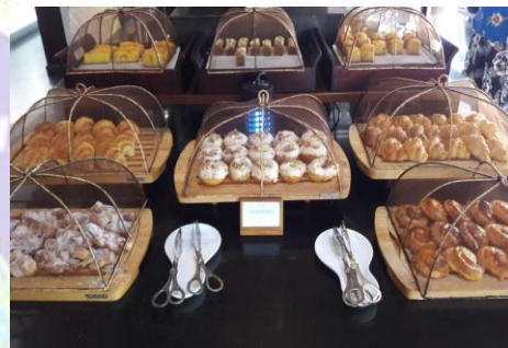
( Assorted cake and bakery station )