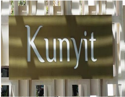
(Logo Kunyit Restaurant )