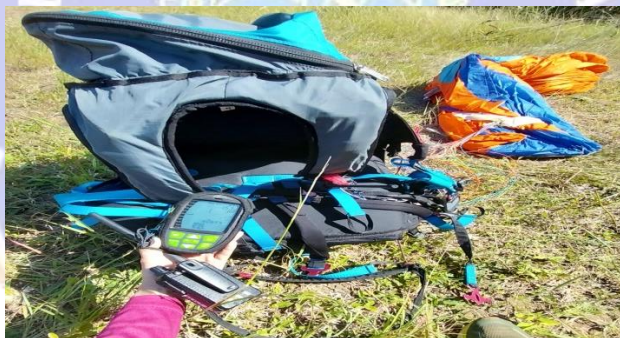
Gambar 5.6 Peralatan Paralayang