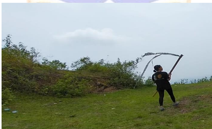
Gambar 5.7 Pengecekan Arah Angin