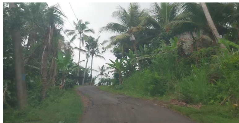
Gambar 5.11 Jalan Puncak Bukit Abah