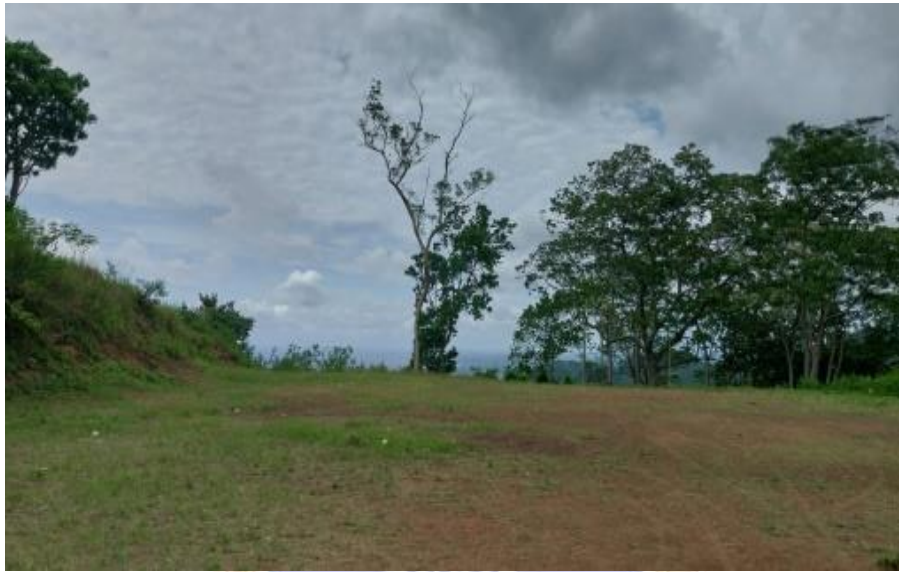
Gambar 5.1 Lokasi Take Off Bukit Abah