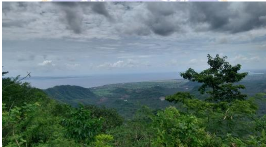
Gambar 5.2 Bukit yang berpotensi Thermal dan Lift