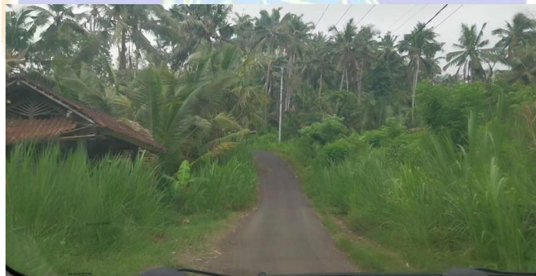
Gambar 5.10 Jalan Bukit Abah