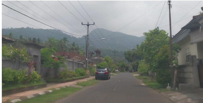
Gambar 5.8 Jalan Desa Dawan