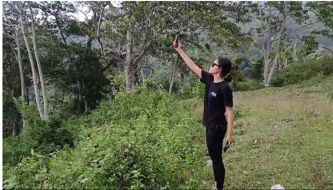
Gambar 5.4 Pengecekan Kecepatan Angin