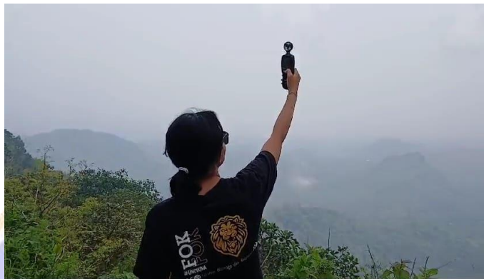
Gambar 5.5 Pengecekan Angin dan Suhu