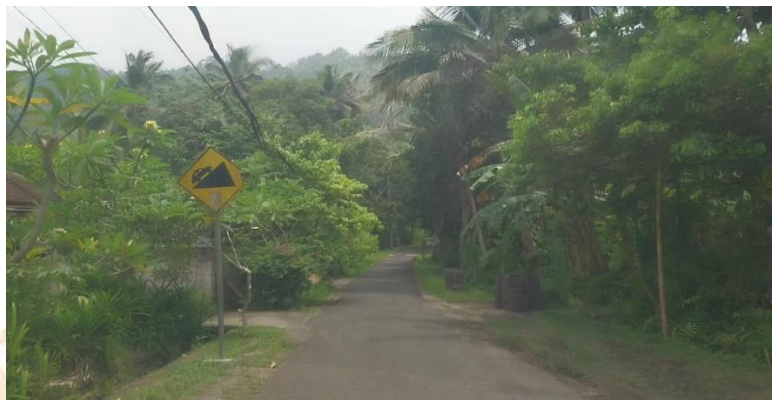
Gambar 5.9 Jalan Menuju Bukit Abah