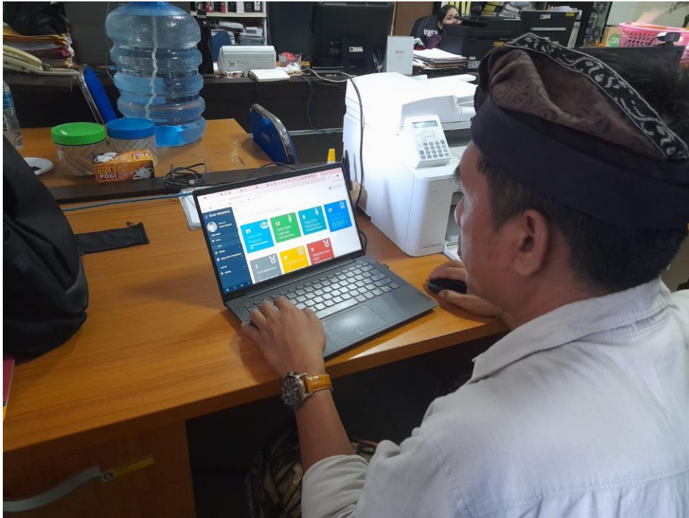
Gambar 5. Dokumentasi Penggunaan Sistem dan Pengisian Kuesioner Responden