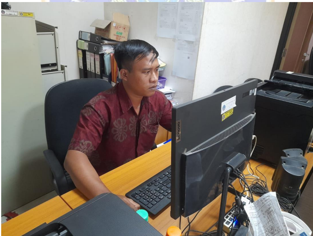
Gambar 4. Dokumentasi Penggunaan Sistem dan Pengisian Kuesioner Responden