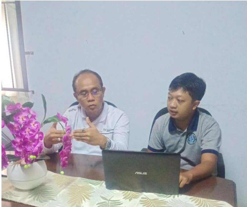
Gambar 1. Observasi ke Mitra