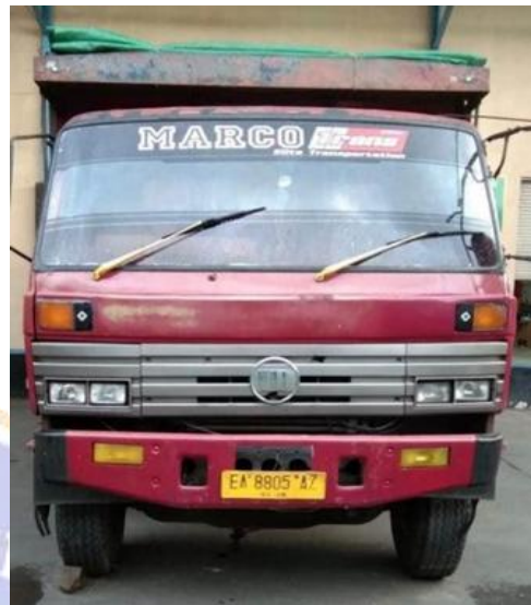
Dokumentasi Keadaan Truck Marco Trans