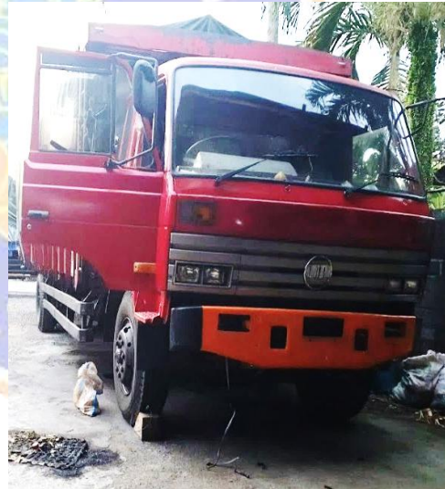
Dokumentasi Perbaikan Truck CV. Bali Marco