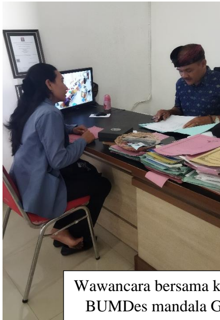
Wawancara bersama ketua BUMDes mandala Giri Amertha