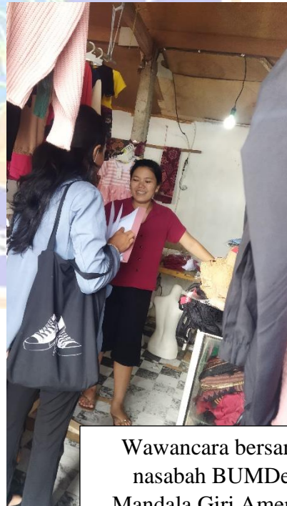
Wawancara bersama nasabah BUMDes Mandala Giri Amertha