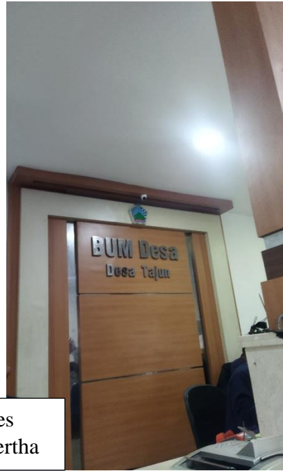
Kantor BUMDes Mandala Giri Amertha