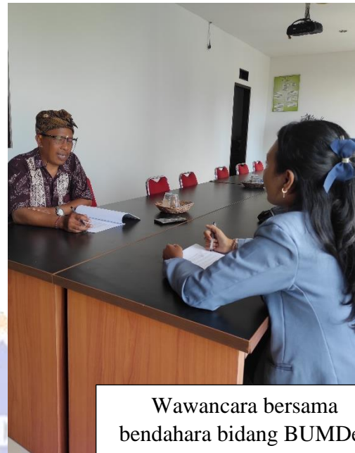
Wawancara bersama bendahara bidang BUMDes Mandala Giri Amertha