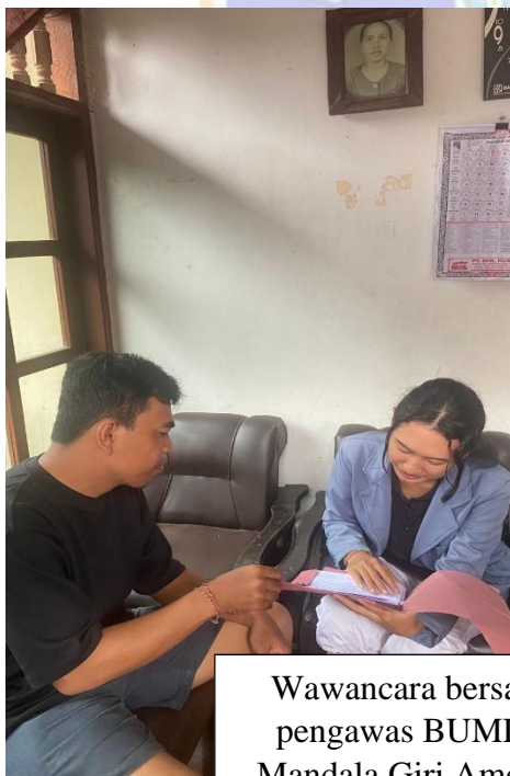
Wawancara bersama pengawas BUMDes Mandala Giri Amertha