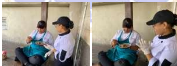
Proses penilaian produk oleh Staff Kitchen