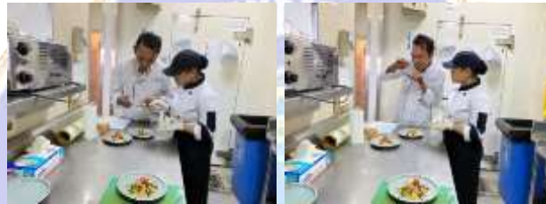
Proses penilaian produk oleh Sous Chef dan Commis Chef