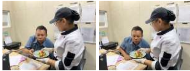
Proses penilaian produk oleh Executive Chef