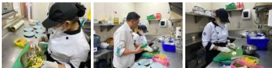
Proses pembuatan Vegetable Salad Combrang Blossom