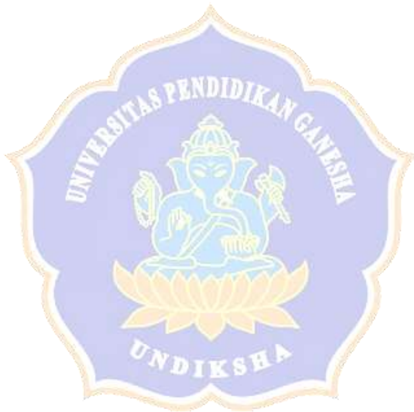
Lampiran 04. Surat Pengantar Pengambilan Data