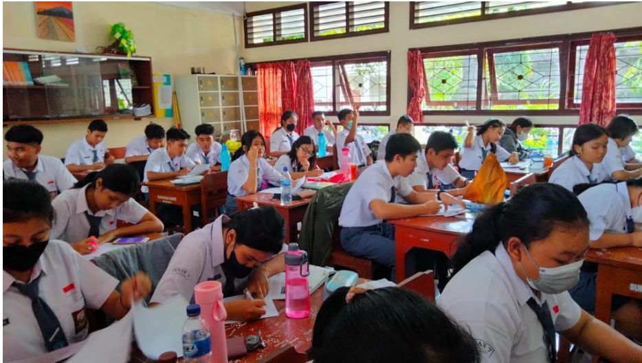
Appendices 6: The documentation after therapy