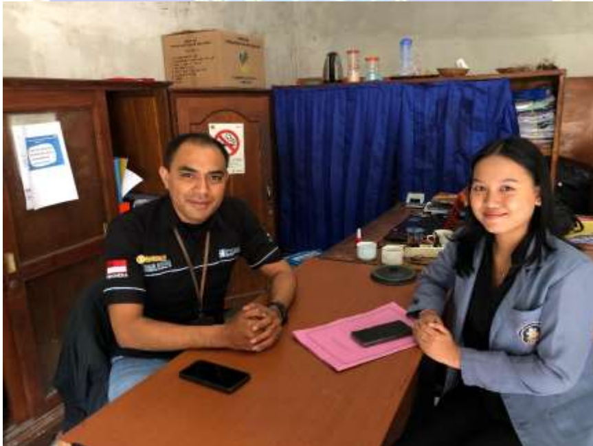
FOTO WAWANCARA DENGAN NARASUMBER 2