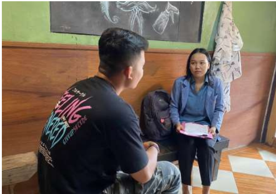
FOTO WAWANCARA DENGAN NARASUMBER 3