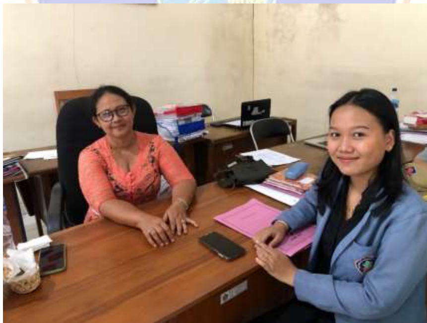
FOTO WAWANCARA DENGAN NARASUMBER 1