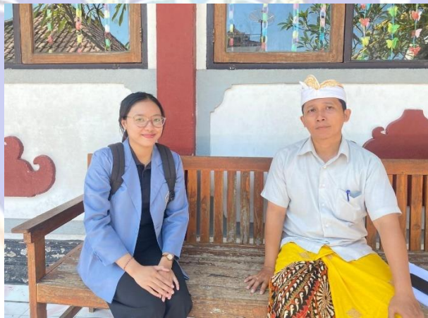
Penelitian di SDN 2 Pemaron