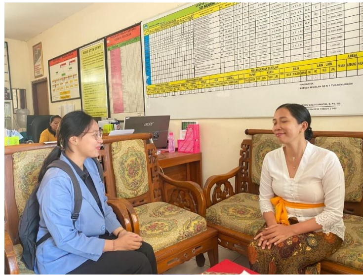
Penelitian di SDN 2 Tukadmungga