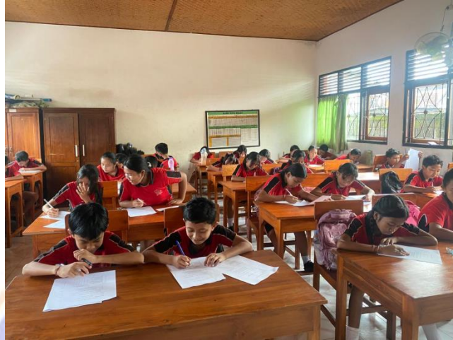
Penelitian di SDN 1 Pemaron