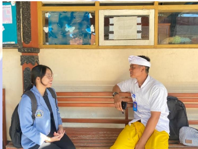
Penelitian di SDN 1 Tukadmungga