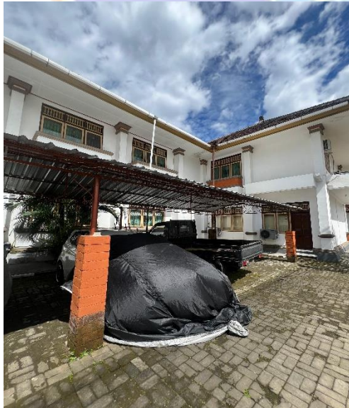
Gambar 6. Mobil yang disimpan di luar Gedung Penyimpanan Barang Bukti