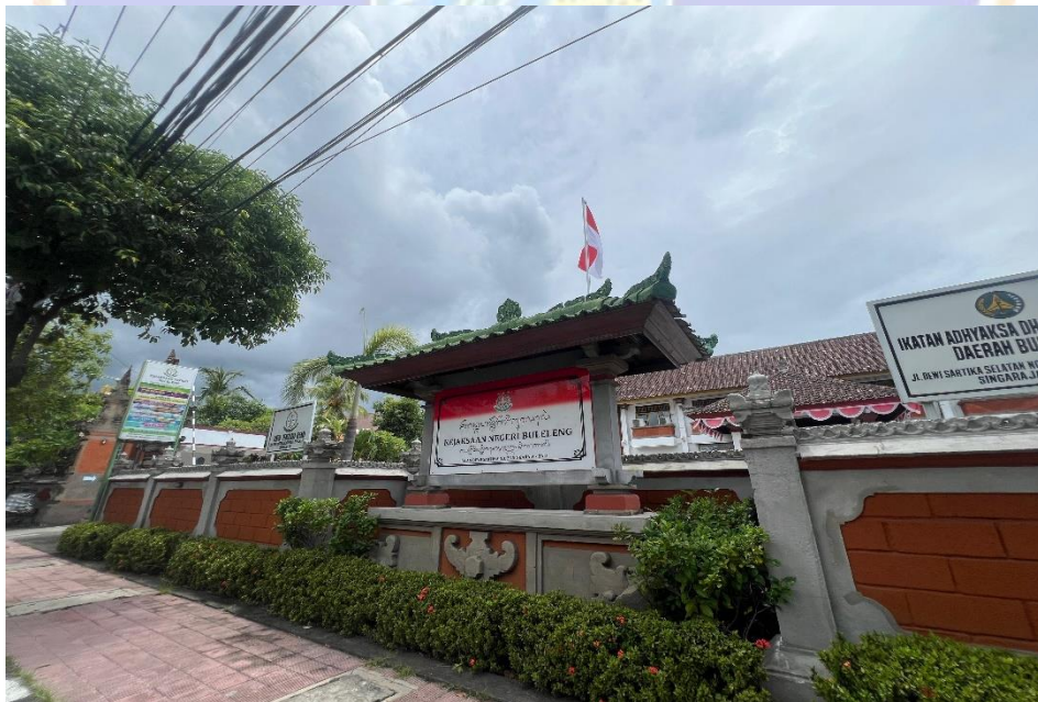
Gambar 3. Lokasi Penelitian