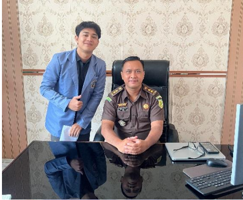
Gambar 1. Wawancara Bersama Kasi PAPBB