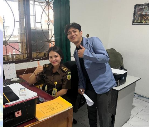
Gambar 2. Wawancara Pranata Barang Bukti