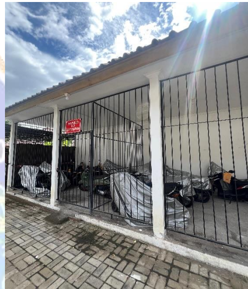
Gambar 5. Gudang Penyimpanan Sepeda Motor