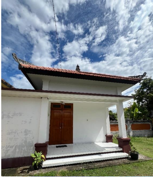
Gambar 4. Gedung Penyimpanan Barang Bukti