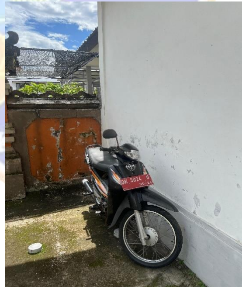
Gambar 7. Mobil yang disimpan di luar Gedung Penyimpanan Barang Bukti