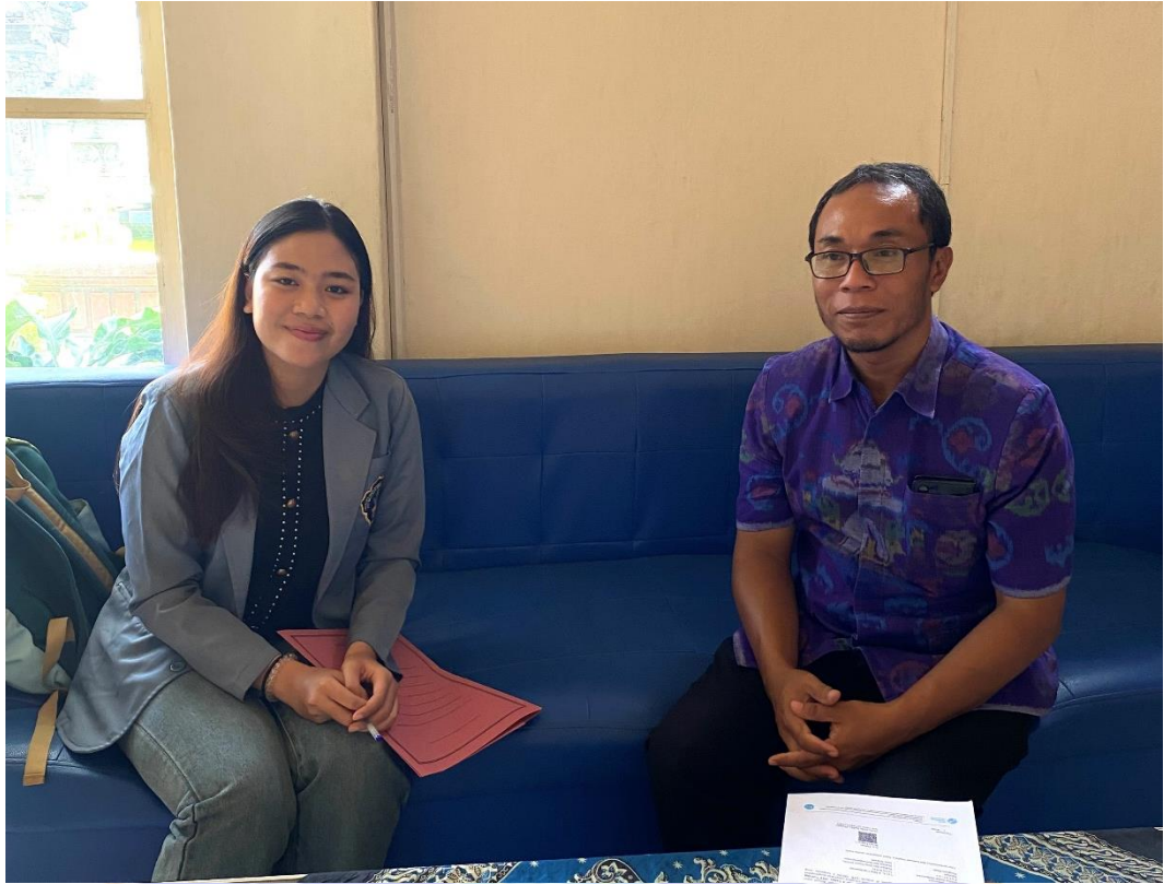
FOTO WAWANCARA DENGAN INFORMAN III