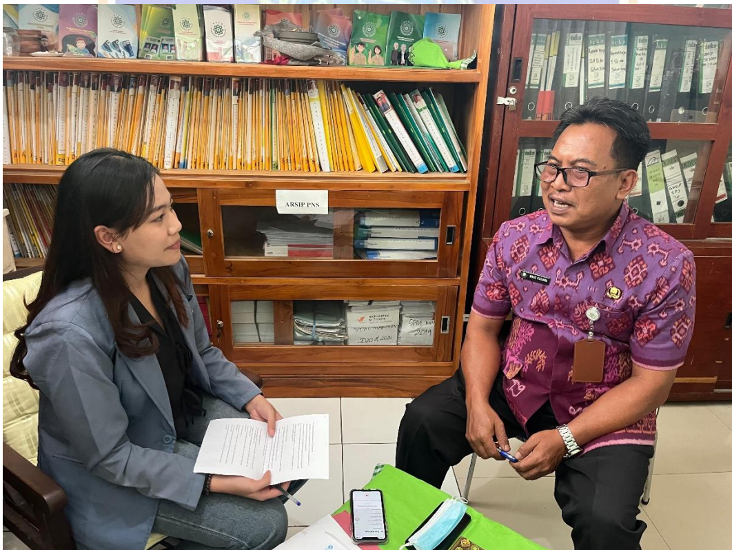
FOTO WAWANCARA DENGAN INFORMAN II