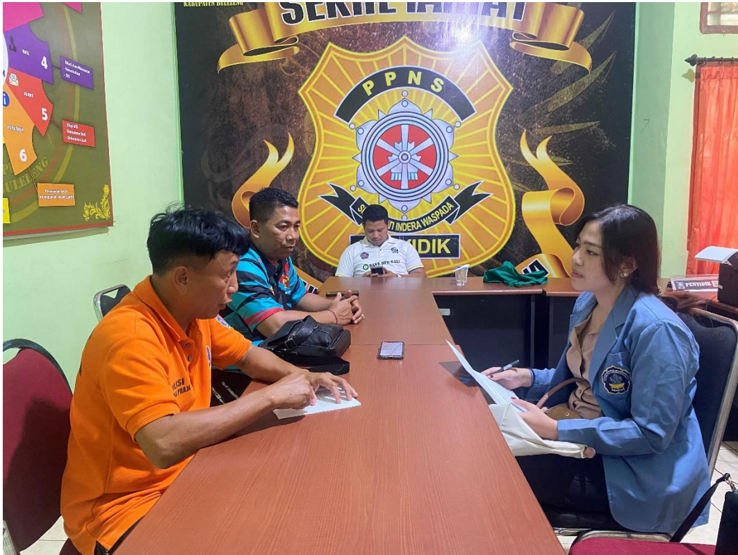
FOTO WAWANCARA DENGAN INFORMAN I