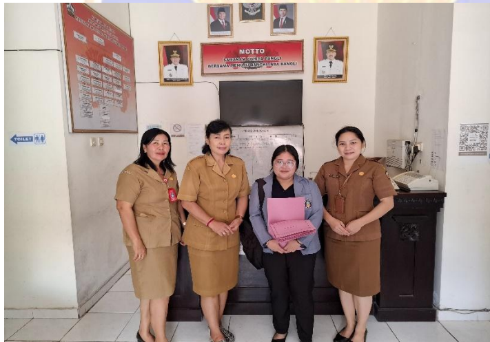
Gambar 2. Wawancara bersama Dinas Koperasi Usaha Kecil Menengah dan Tenaga kerja Kabupaten Bangli