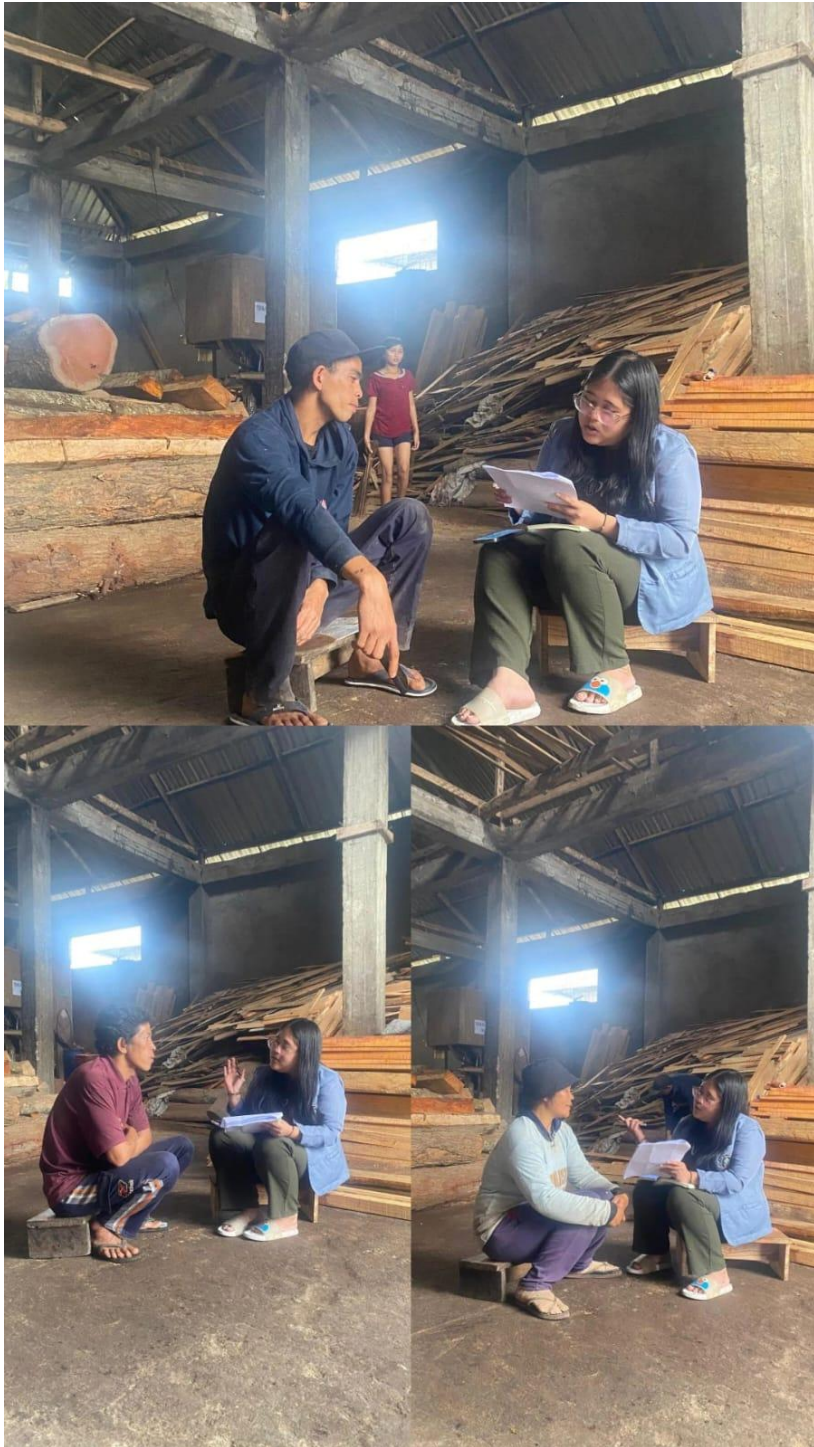
Gambar 5. Wawancara dengan pekerja di lokasi 1 UD Sari Karya