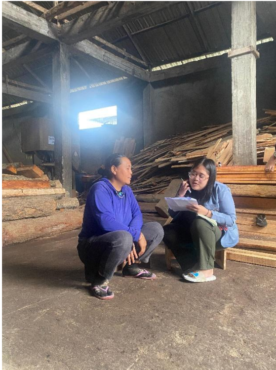
Gambar 3. Wawancara dengan pemilik usaha UD Sari Karya