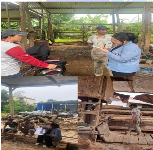
Gambar 4. Wawancara dengan pekerja di lokasi 2 UD Sari Karya