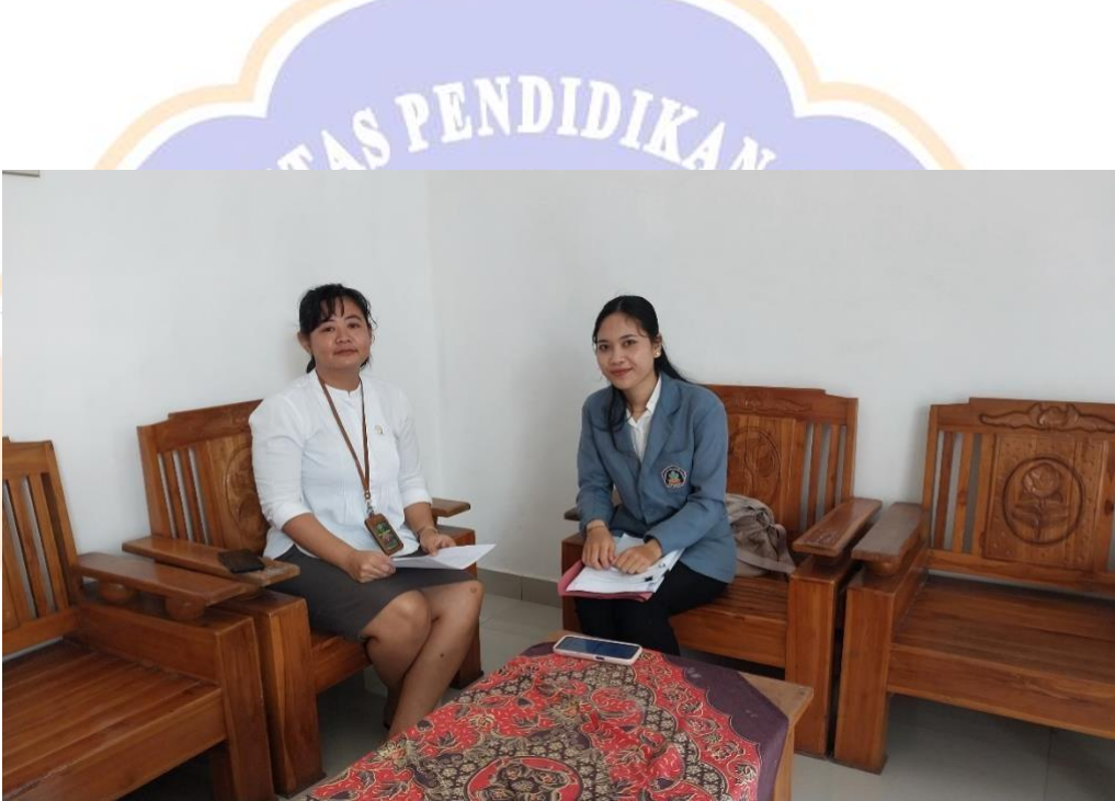
WAWANCARA DENGAN NARASUMBER 2