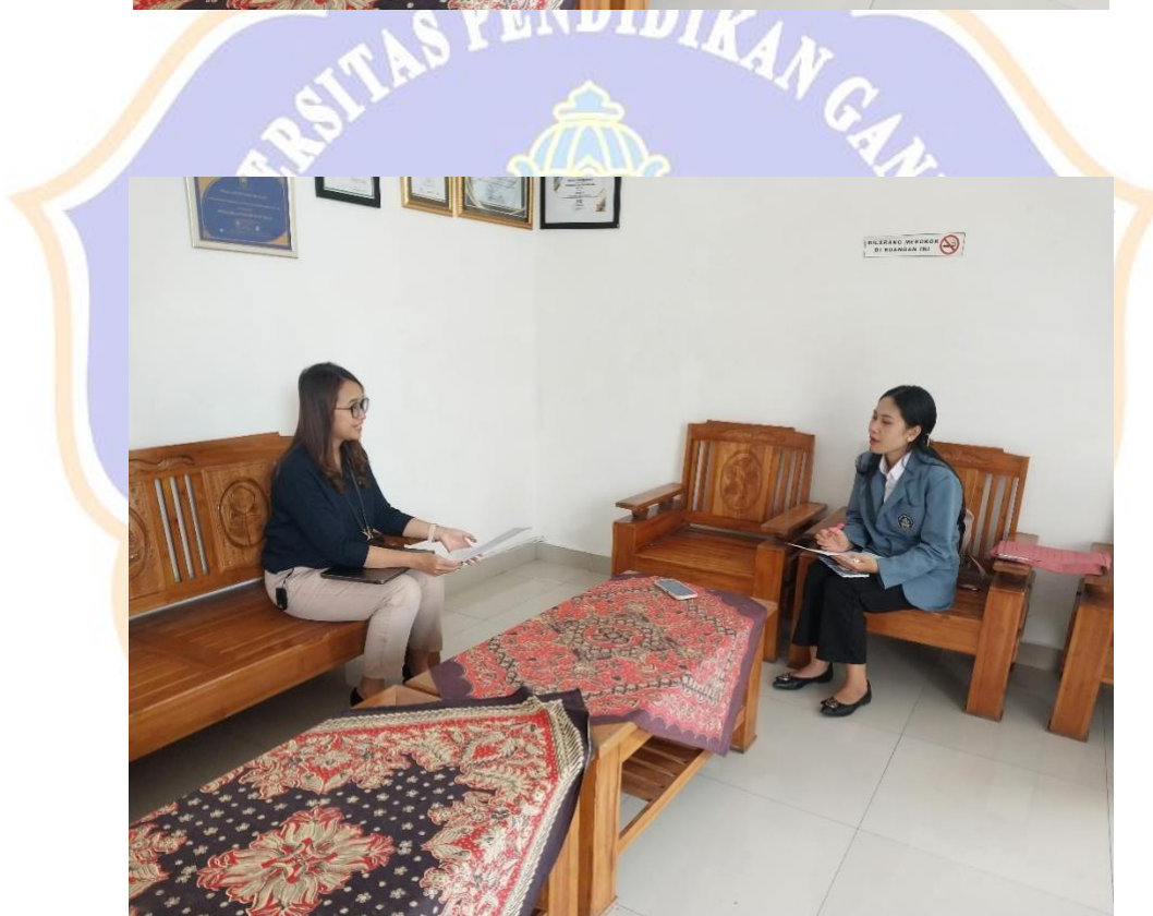
WAWANCARA DENGAN NARASUMBER