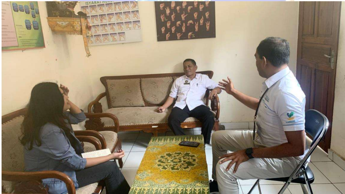
Gambar 2. Wawancara di Dinas Sosial Kabupaten Buleleng