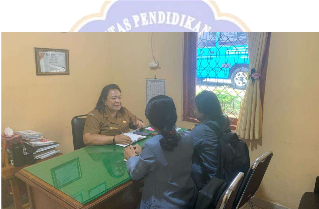
Gambar 3. Wawancara di Dinas P2KBP3A Kabupaten Buleleng