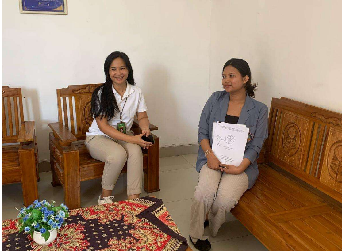
Gambar 1. Wawancara di Pengadilan Negeri Singaraja Kelas IB