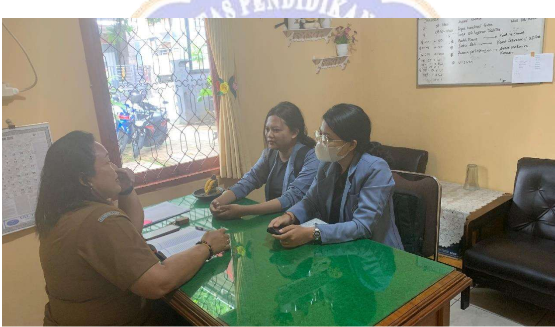
Wawancara dengan Informan II