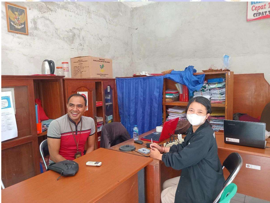
Wawancara dengan Informan I