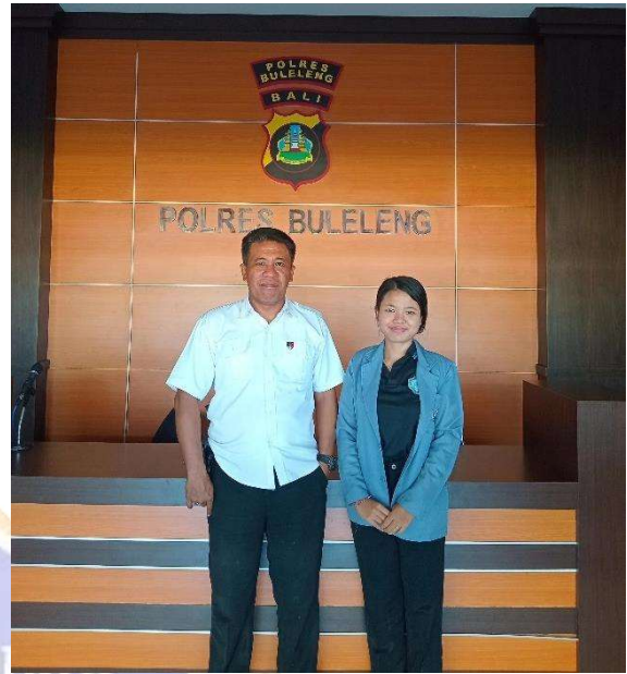
Wawancara dengan Narasumber