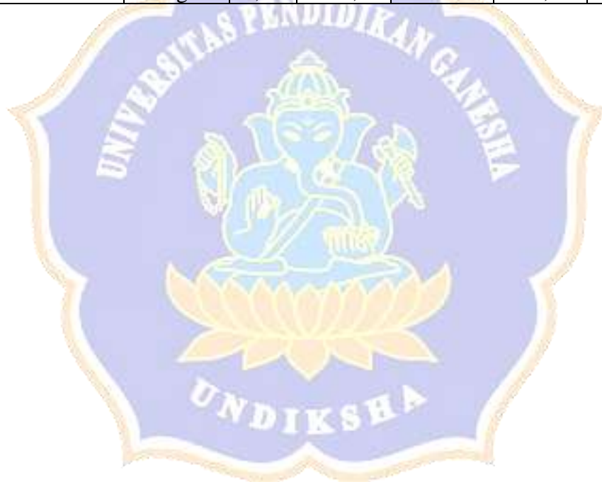
Lampiran 12. Kebutuhan Energi Siswa Berdasarkan Masa Pertumbuhan