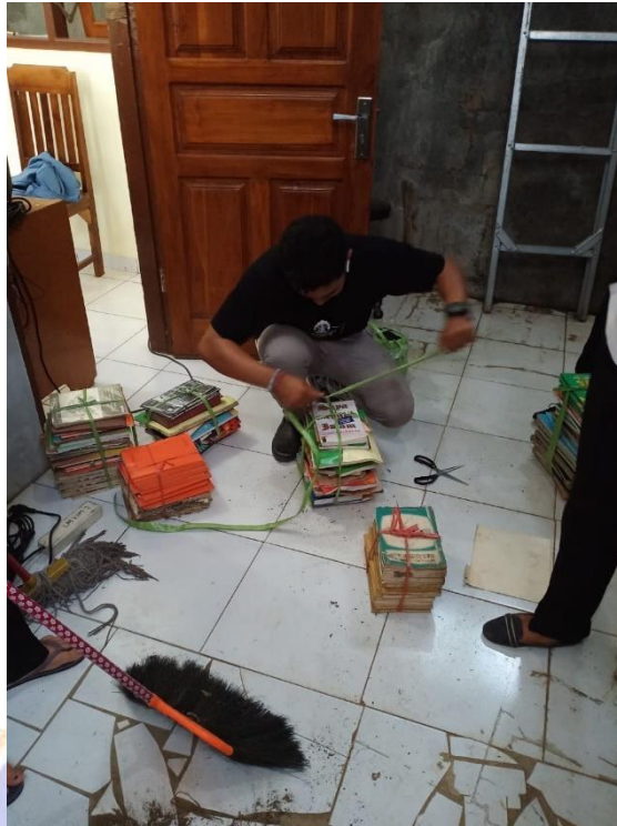
Proses Sleksi Buku Yang Berkadaan Baik