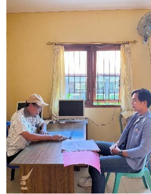
Wawancara dengan Kepala BUMDES Giri Amertha Sadhu mengenai keadaan BUMDes