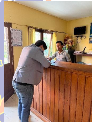
Wawancara dengan Humas BUMDES Giri Amertha Sadhu mengenai dokumen dan data operasional BUMDes