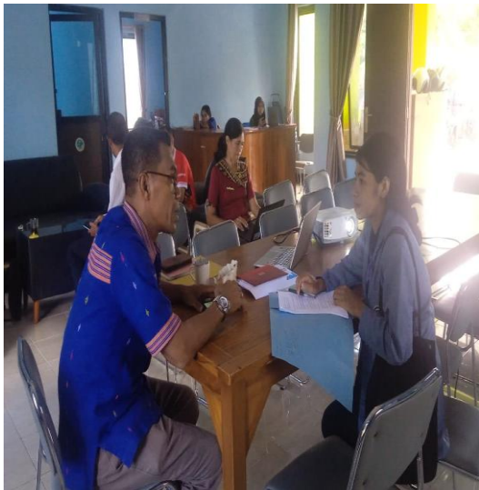
Gambar: Wawancara dengan Kepala Dinas Pariwisata