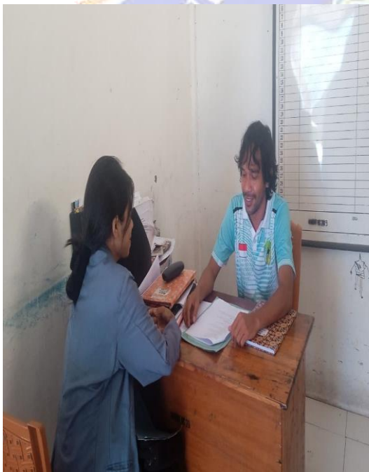
Gambar: Wawancara Dengan Kaur Perencanaan Kantor Desa Gorontalo Labuan Bajo