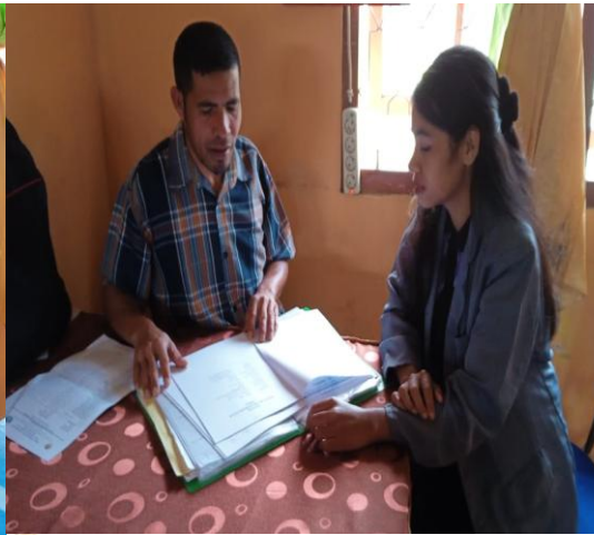
Gambar: Wawancara Dengan Guru Sejarah