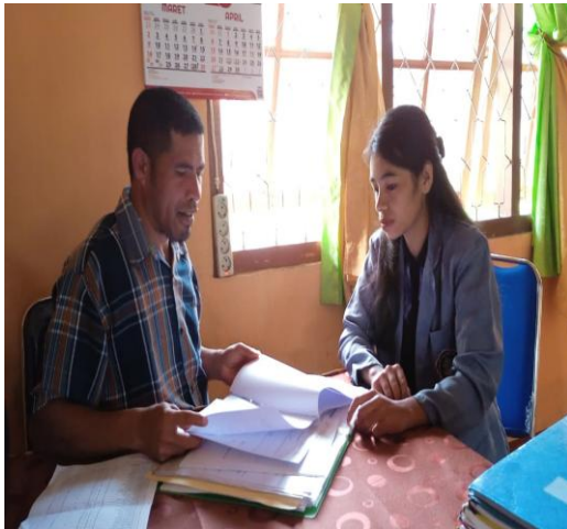
Gambar: Wawancara Dengan Guru Sejarah