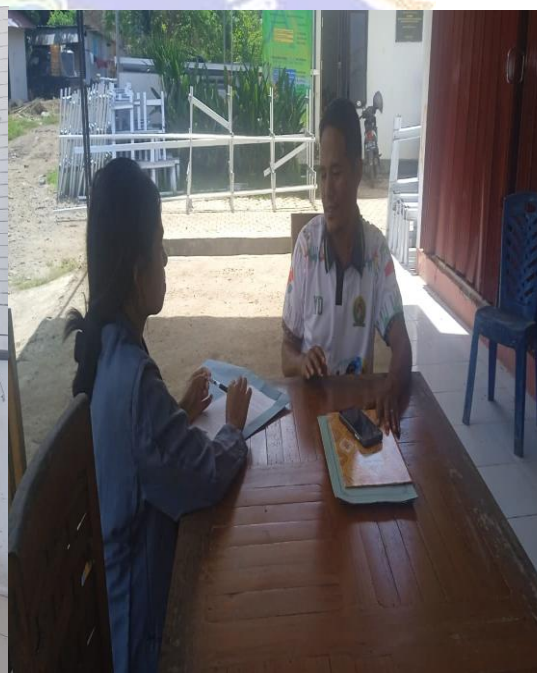
Gambar: Wawancara Bersama Bapak Kepala Seksi Pemerintahan Kantor Desa Cermin Labuan Bajo