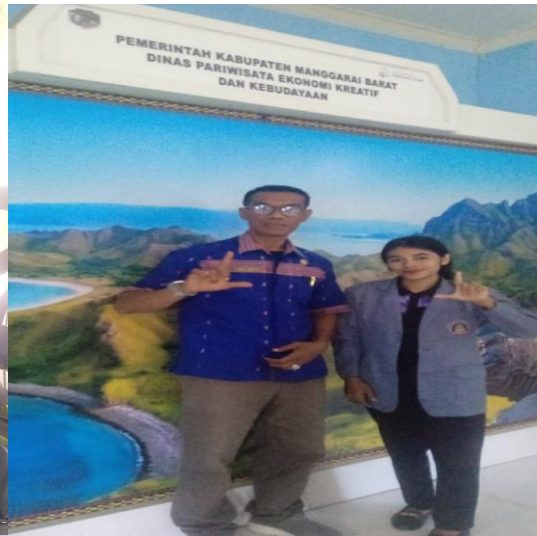
Gambar: Foto dengan Kepala Dinas Pariwisata