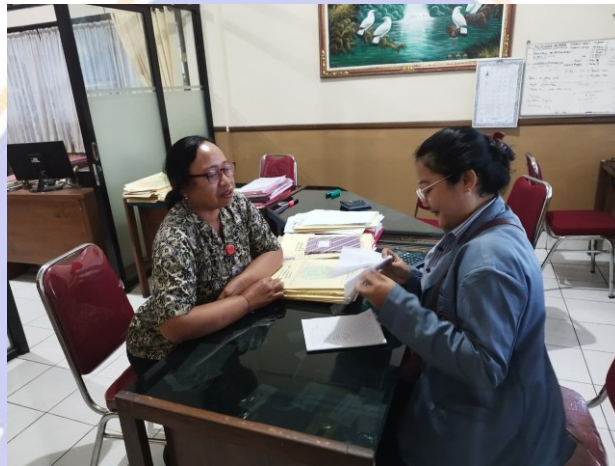
(Wawancara dengan Bendahara)