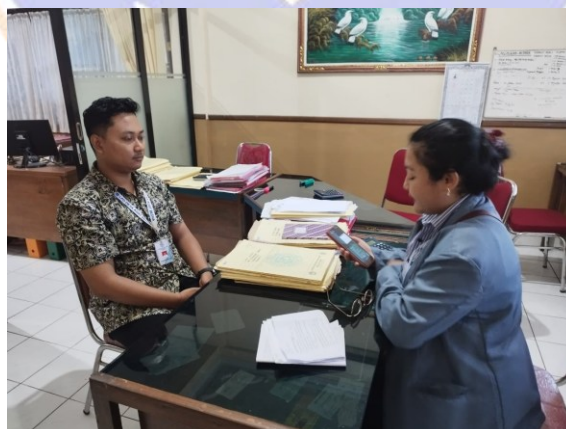
(Wawancara dengan Tim IT)