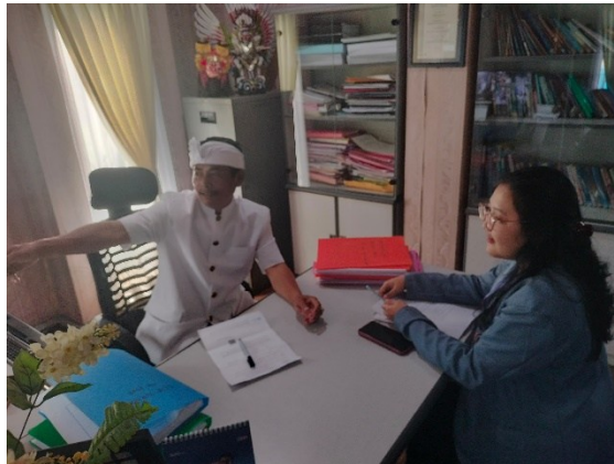
(Wawancara dengan Pemucuk LPD)