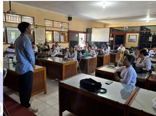
2. SMKN 1 Seririt