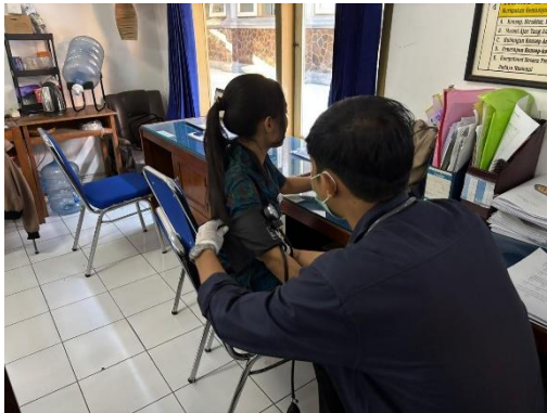
1. SMAN 1 Seririt