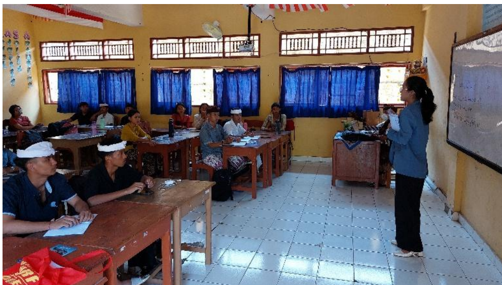
Lampiran 13. Dokumentasi Kegiatan Pengambilan Data di SMA Negeri 1 Sukasada