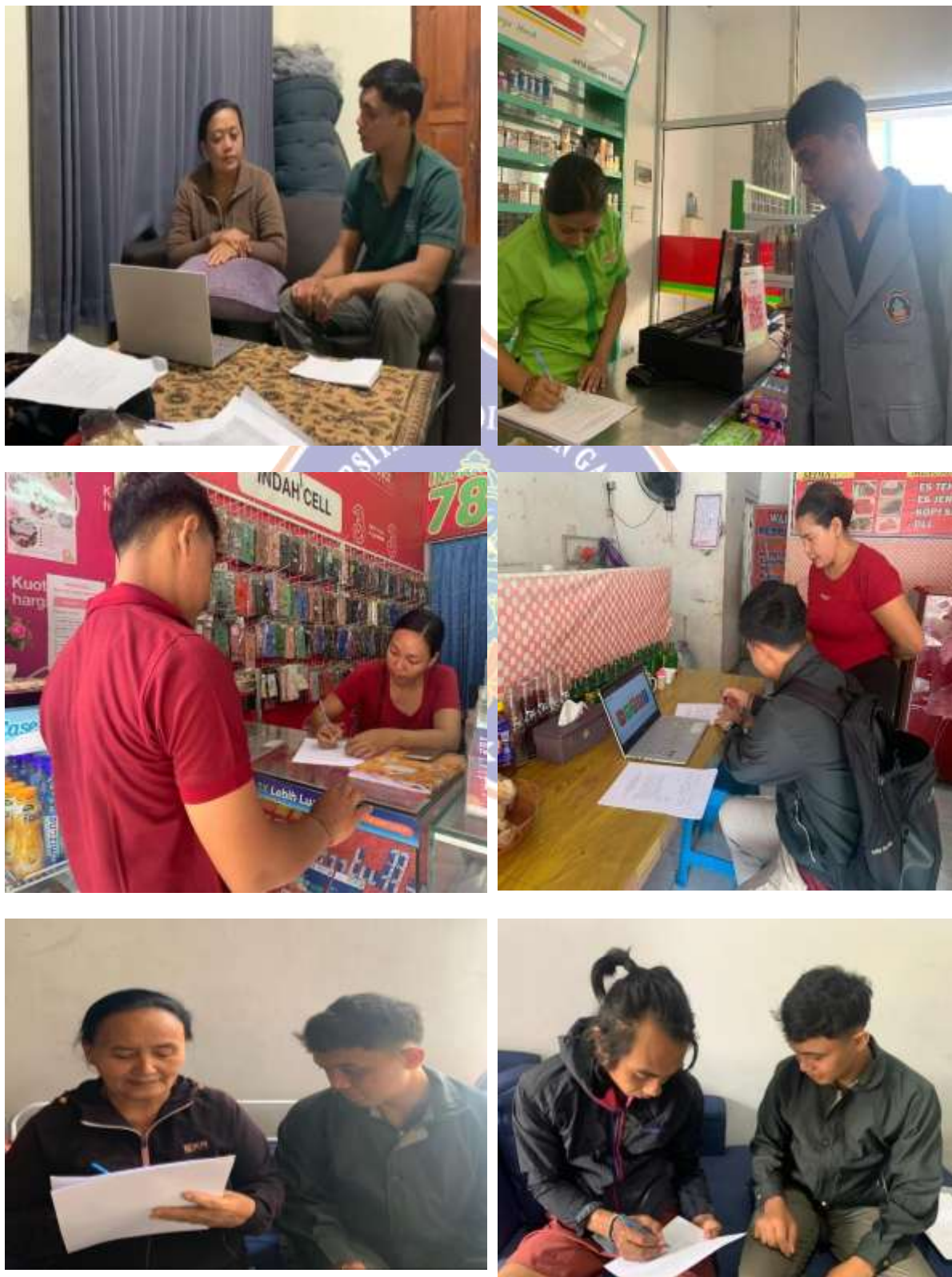
Lampiran 3. Dokumentasi Pengambilan Data Design Thinking.

https://docs.google.com/spreadsheets/d/1Q35Jv9LTw4nWcxGKwod6WemMO_s54_VO/edit?usp=sharing&ouid=101737389819532183767&rtpof=true&sd=true