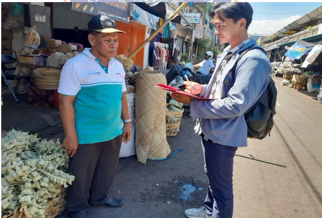
WAWANCARA DENGAN PENGUNJUNG DI PASAR ANYAR SINGARAJA