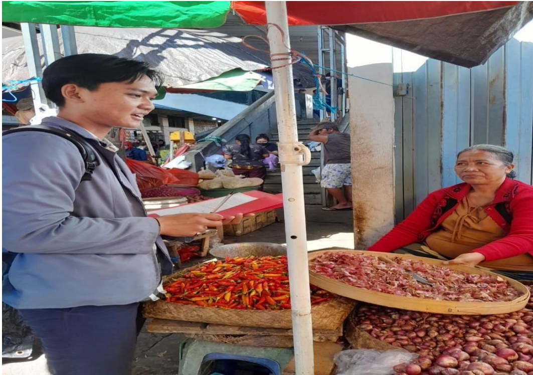
WAWANCARA DENGAN PEDAGANG DI PASAR ANYAR SINGARAJA