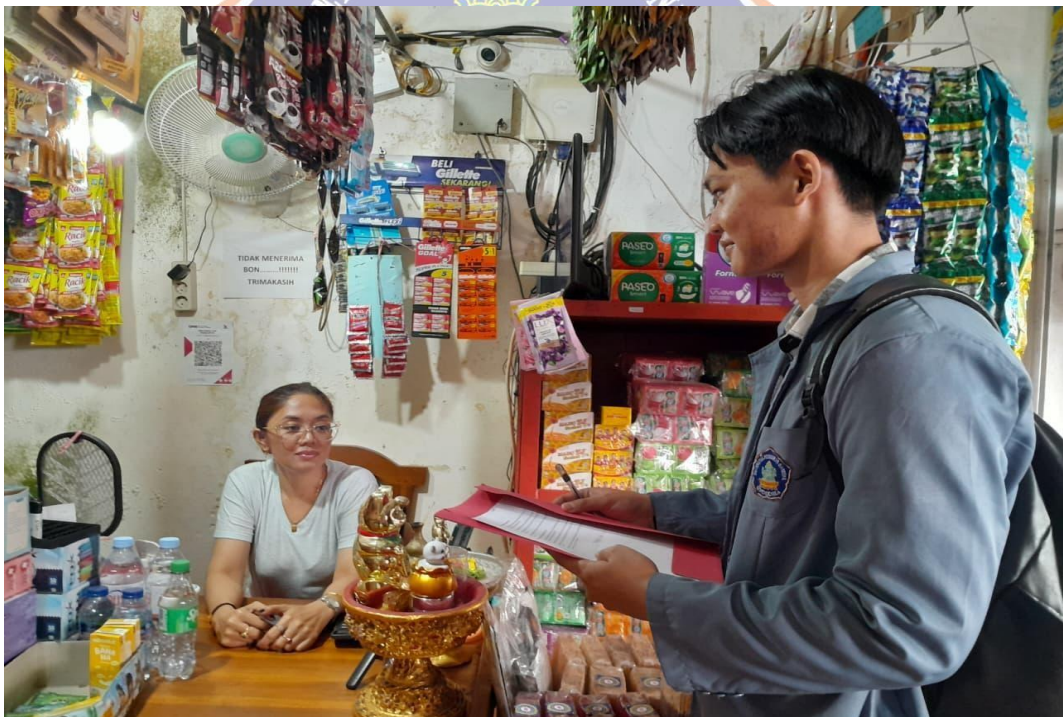
WAWANCARA DENGAN PEDAGANG DI PASAR ANYAR SINGARAJA