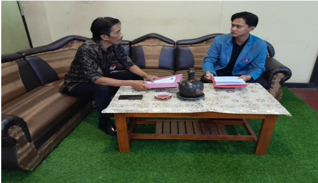
WAWANCARA DENGAN KEPALA BAGIAN UMUM PERUMDA PASAR ARGA ARGA NAYOTTAMA