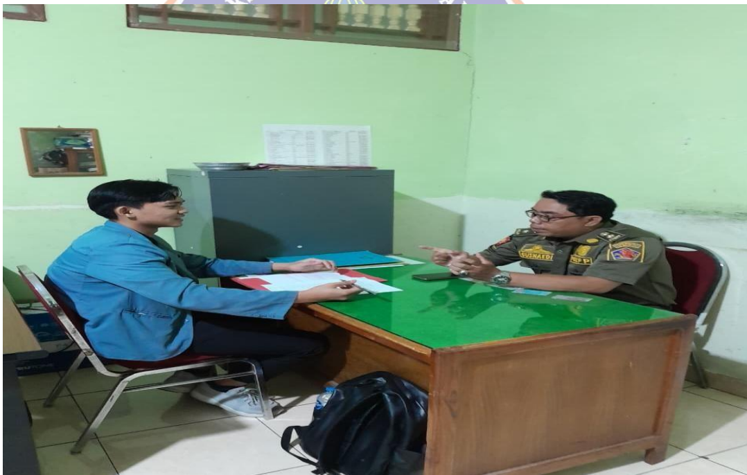
WAWANCARA DENGAN PPNS BIDANG PENEGAKAN PERATURAN PERUNDANG – UNDANGAN SATPOL PP PEMERINTAH KABUPATEN BULELENG