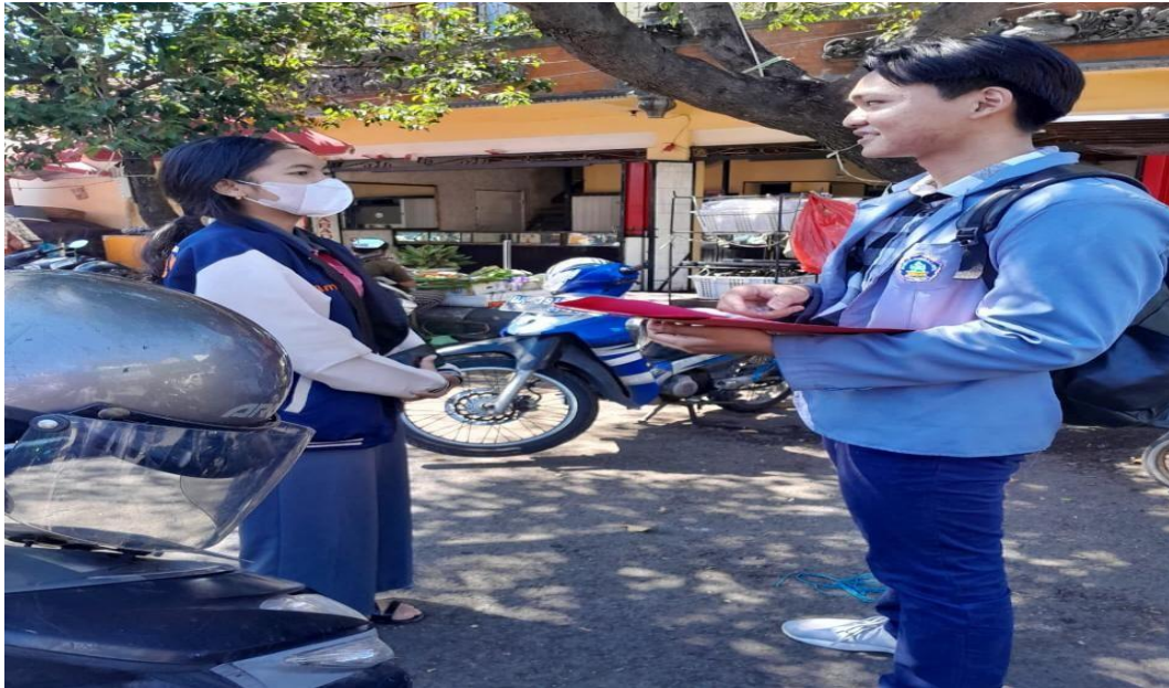
WAWANCARA DENGAN PENGUNJUNG DI PASAR ANYAR SINGARAJA