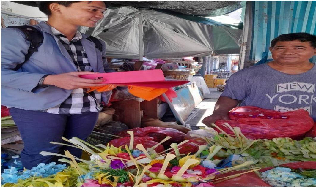
WAWANCARA DENGAN PEDAGANG DI PASAR ANYAR SINGARAJA