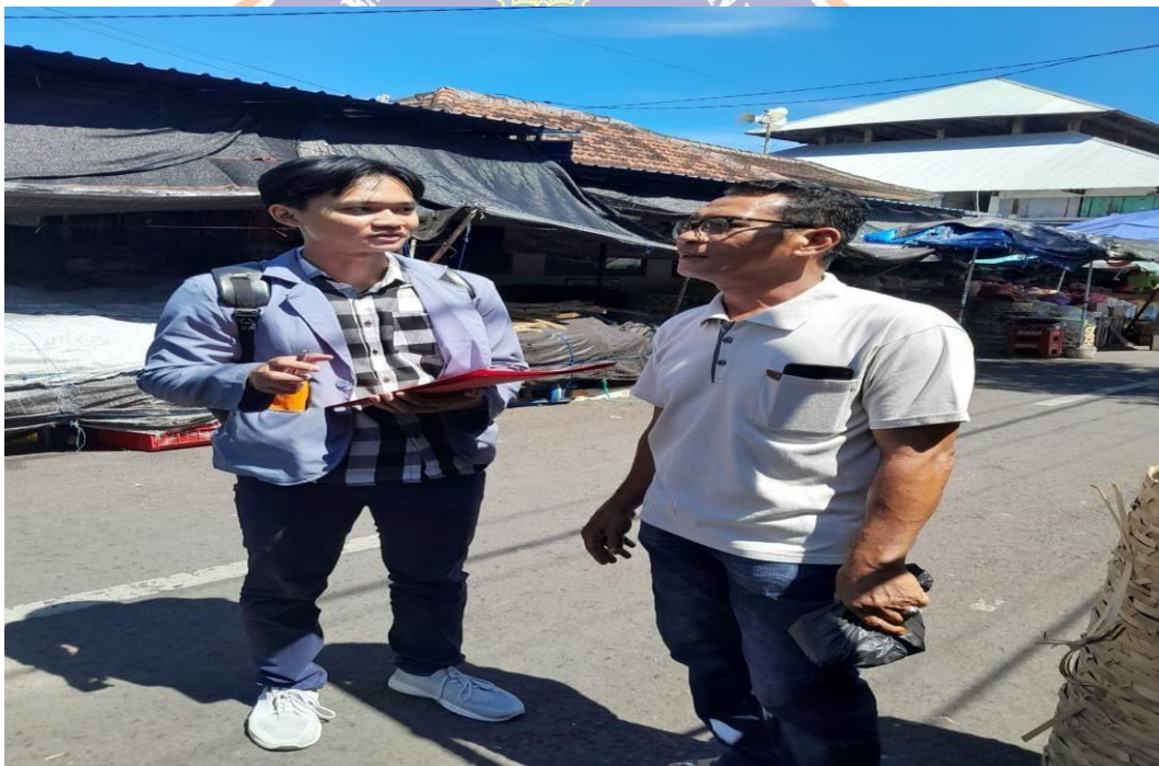
WAWANCARA DENGAN PENGUNJUNG DI PASAR ANYAR SINGARAJA