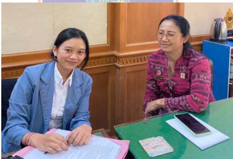
Lampiran 6. Wawancara bersama Penyuluh Hukum Ahli Muda Kanwil Kemenkum Bali