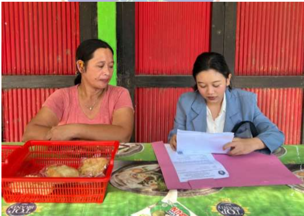
Lampiran 9. Wawancara dengan warga yang belum menerima layanan Pos Bantuan Hukum Desa Kubutambahan