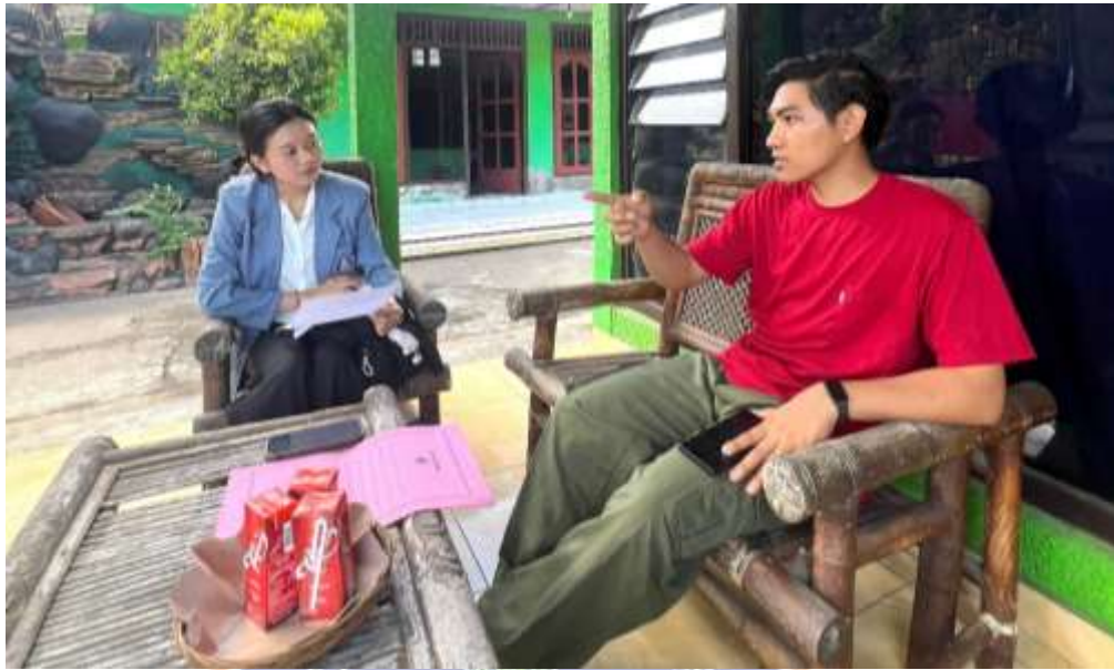
Lampiran 8. Wawancara dengan warga yang telah menerima layanan mediasi Pos Bantuan Hukum Desa Kubutambahan