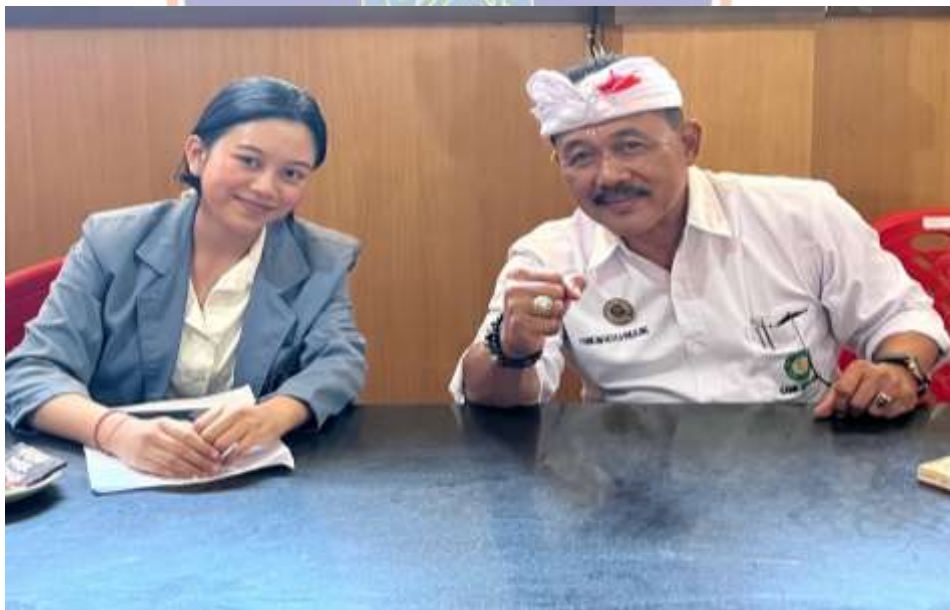
Lampiran 7. Wawancara bersama Kepala Desa Kubutambahan