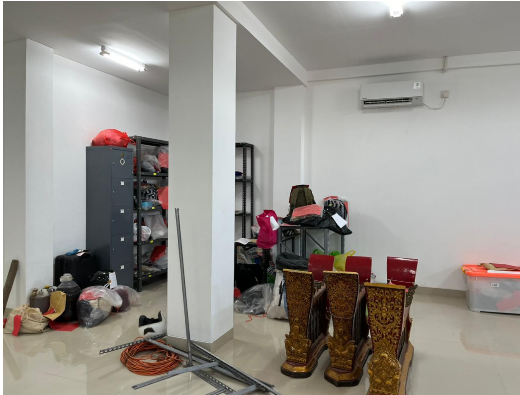
Lampiran 11. Ruang Penyimpanan Barang Bukti.