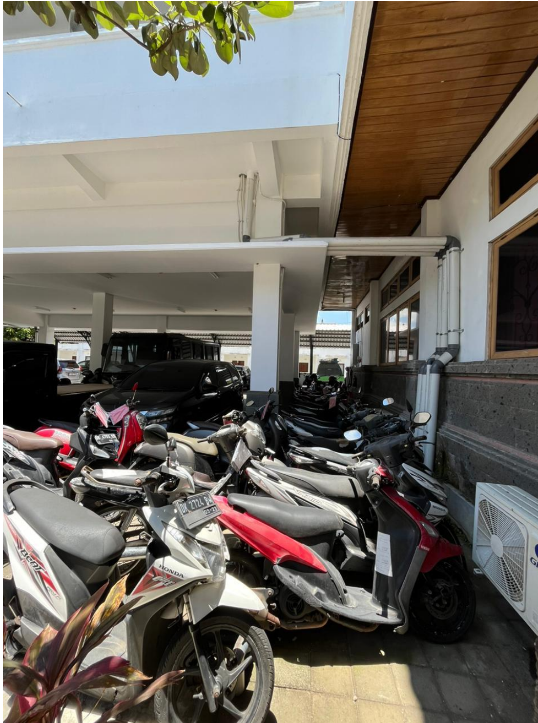
Lampiran 14. Barang bukti yang diletakkan di luar tempat penyimpanan