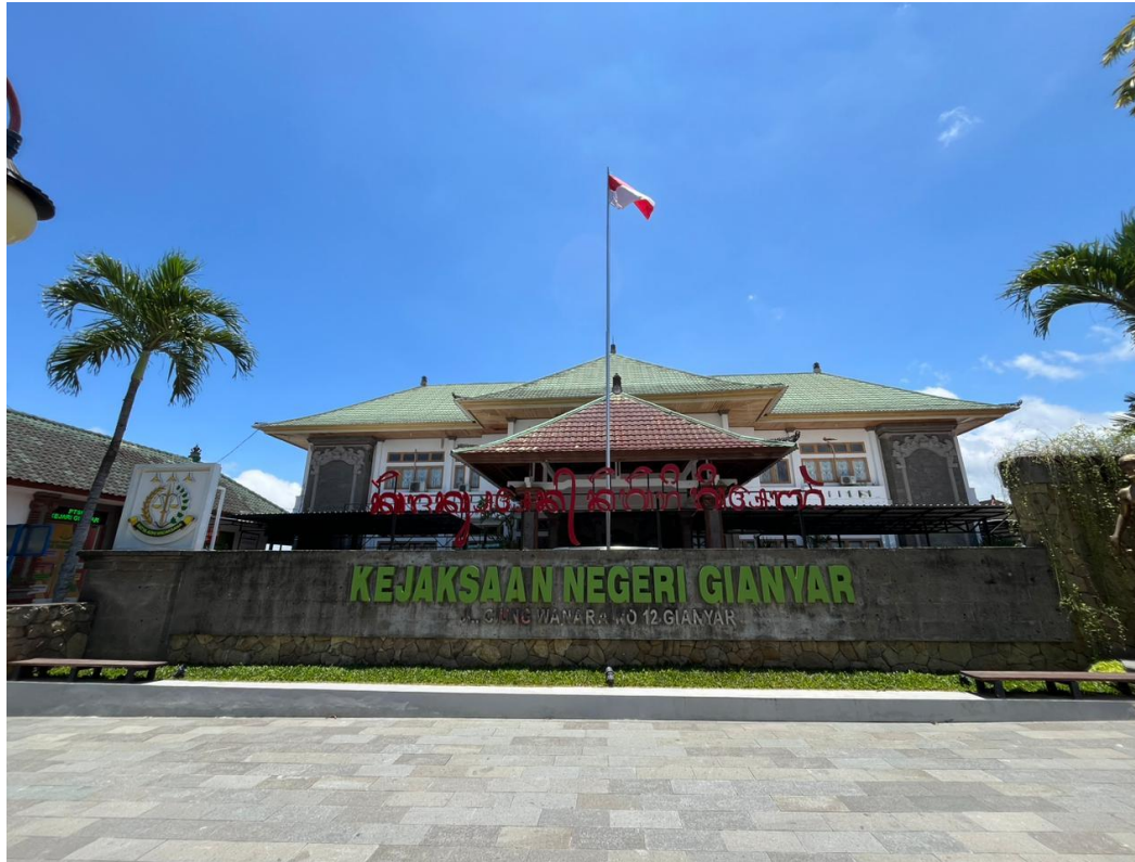
Lampiran 10. Lokasi Penelitian