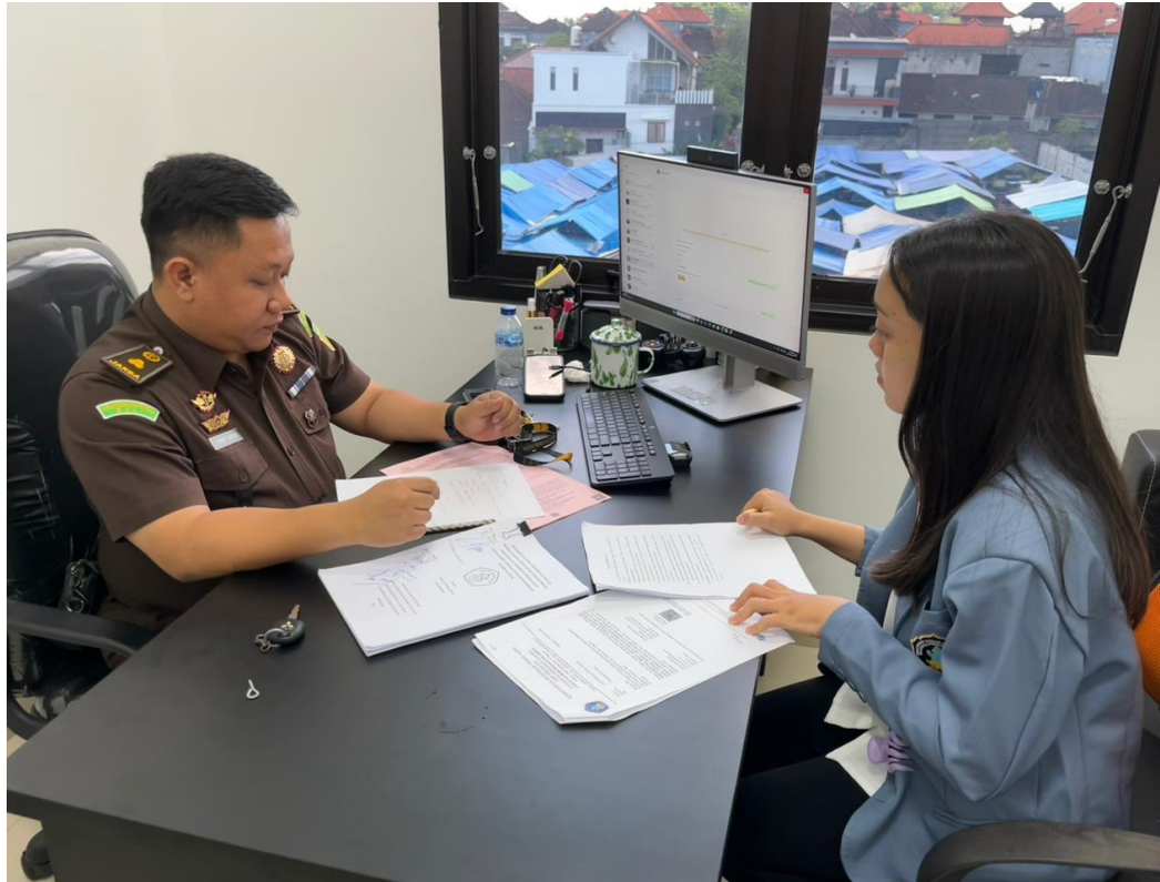
Lampiran 7. Wawancara bersama Kepala Seksi Pemulihan Aset dan Pengelolaan Barang Bukti, Kejaksaan Negeri Gianyar.