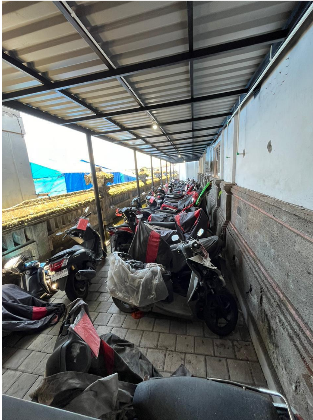
Lampiran 13. Tempat penyimpanan barang bukti