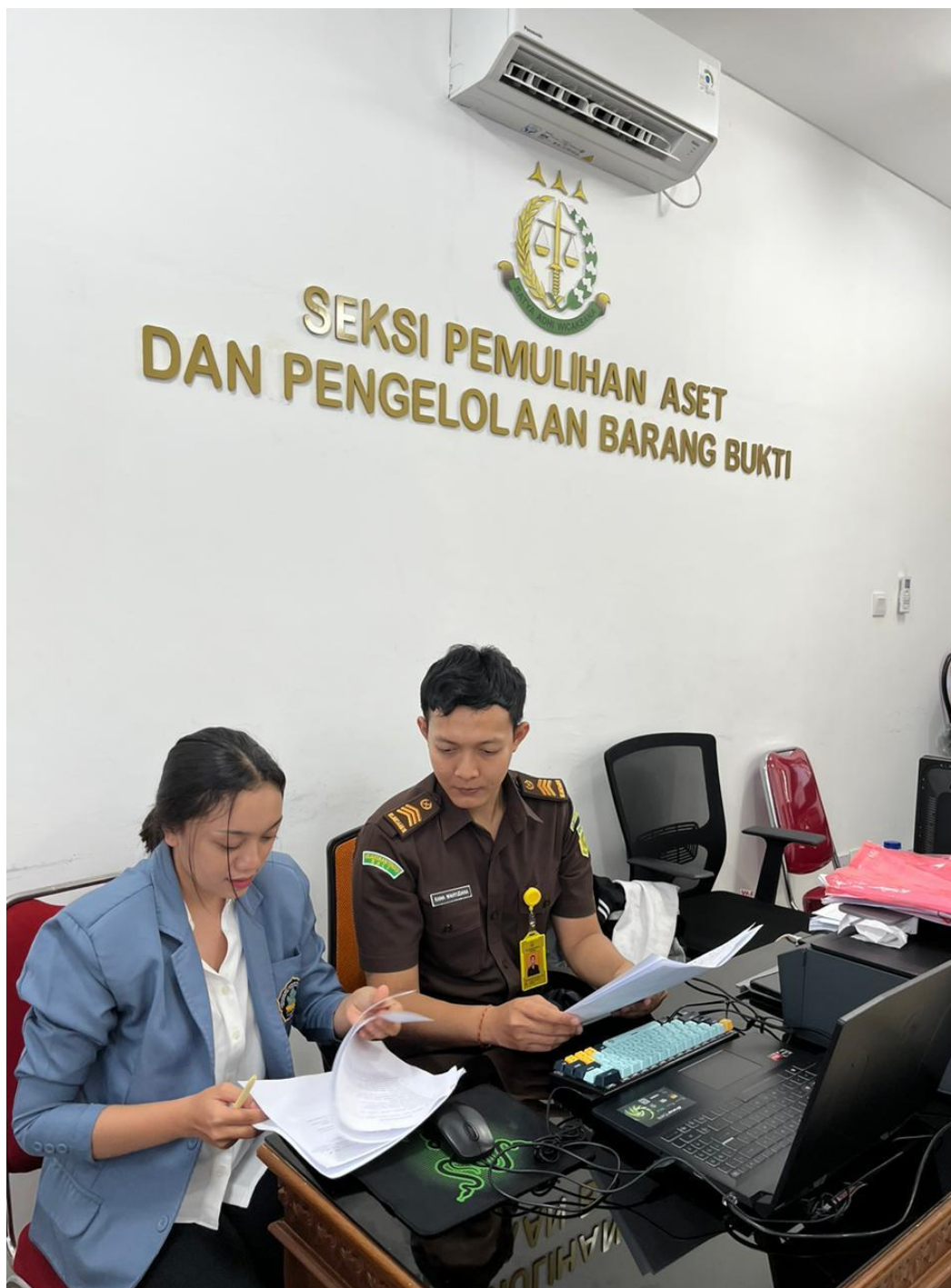
Lampiran 8. Wawancara bersama petugas barang bukti.