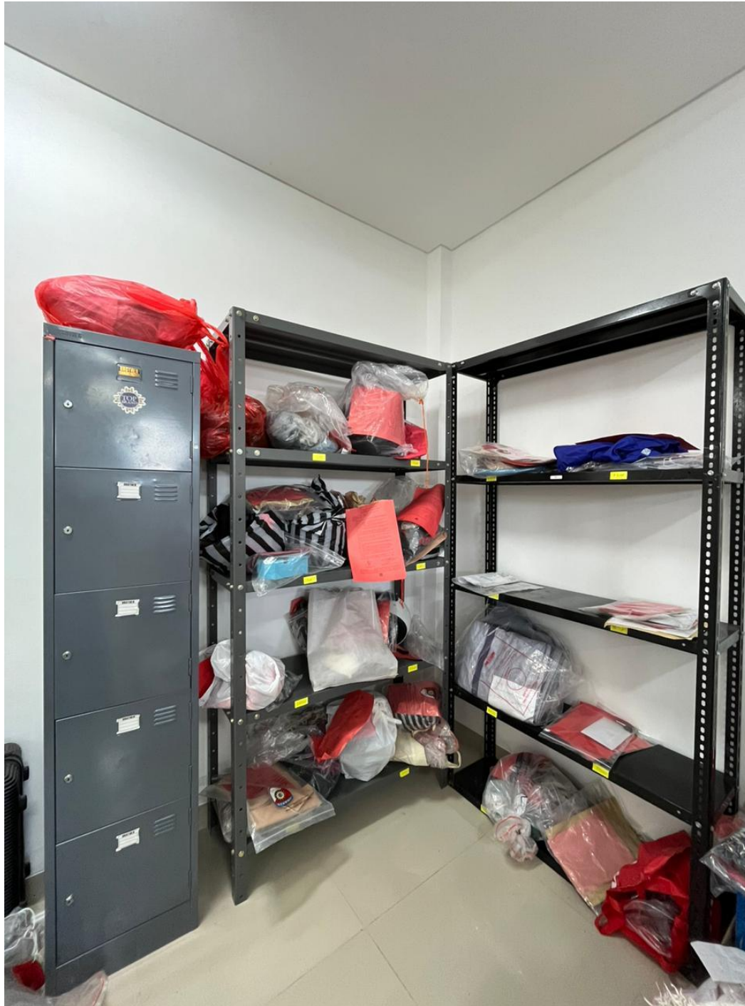
Lampiran 12. Rak penyimpanan barang bukti