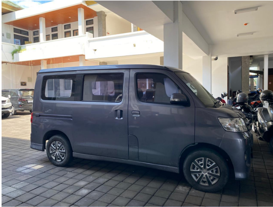
Lampiran 15. Mobil pengantaran barang bukti