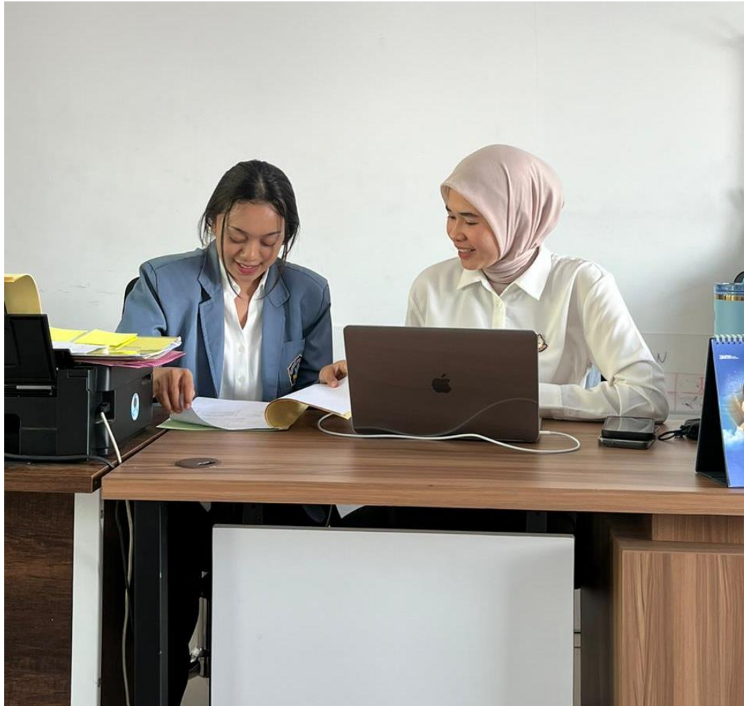
Lampiran 9. Wawancara bersama salah satu Jaksa Penuntut Umum.